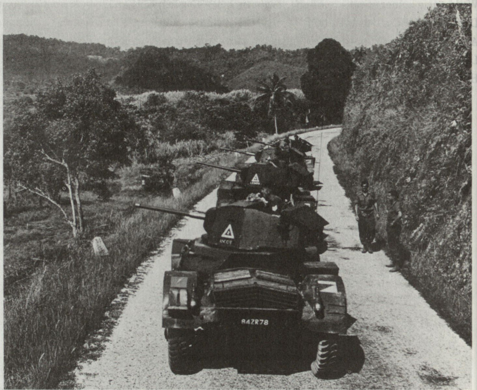
Bild 2. Aufklärungstrupp der malaysischen Armee in einem partisanenverdächtigen Gebiet.

Während des vergangenen Jahres kam es wiederholt zu Überfällen der