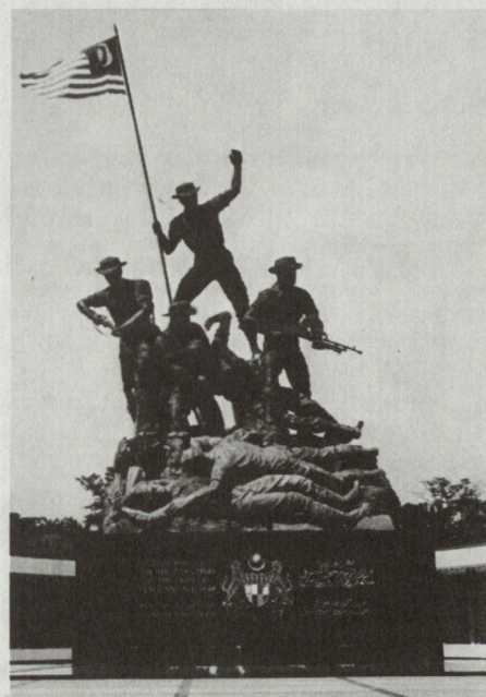
Bild 3. Das Ende August 1975 von den Guerillas mit Zeitbomben beschädigte Denkmal mitten in Kuala Lumpur, das den Sieg über den kommunistischen Aufstand (1948–1960) symbolisiert.

Insurgenten – ebenfalls zu Säuberungsaktionen seitens der Armee –, doch war ein Nachlassen des Partisanen-Untergrundes deutlich zu spüren. Im Perat-Gebiet jagten Regierungstruppen versteckte Rebellen. Rund 100 000 Flugblätter mit der Aufforderung zum Überlaufen wurden abgeworfen; abgebildete Photos von getöteten Guerillas fragten die Finder, ob sie das gleiche Schicksal erleiden wollten.