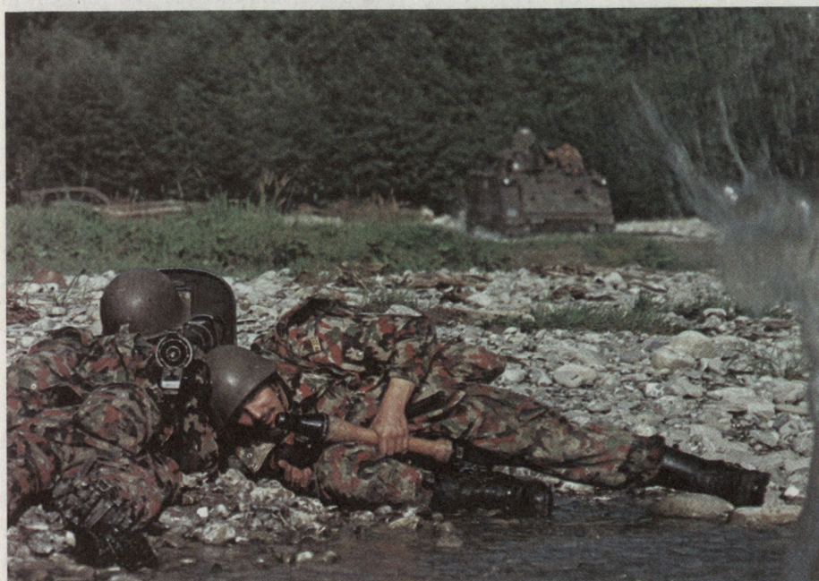
Bild 2: Schützenpanzer 63/73 einer Panzergrenadierkompanie beim Überqueren eines Flusses.

der Lage, diese Gefechtsnachrichten detailliert und umfassend zu übermitteln. Immer wieder muss man jedoch bei Manövern feststellen, dass dem Nachrichtendienst zu wenig Beachtung geschenkt wird und wichtige Meldungen nicht oder ungenau übermittelt werden. Es kann sein, dass die jeweiligen Übungsbestimmungen über Markeure und Feinddarstellungen zu wenig ernst genommen werden oder dass es nur an der Vorstellungskraft der Truppe fehlt. Beachtenswert ist jedoch die Feststellung, dass auch bei Kriegshandlungen im Ausland auf dem Sektor Nachrichtendienst immer wieder unbegreifliche Fehler vorkamen.