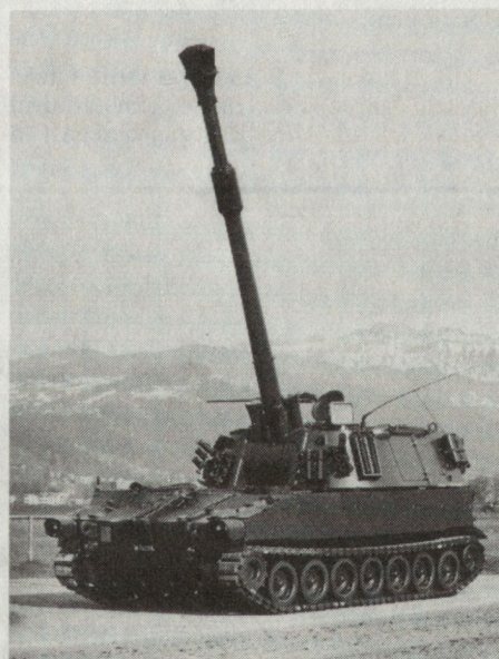
Pz Hb 74 (M 109)

Mit den zu beschaffenden Panzerhaubitzen (siehe Abbildung) sollen neun bestehende Haubitzenabteilungen in den Divisionen der Feldarmee umgerüstet werden. Heute verfügt die mobile Artillerie über 12 Panzerhaubitzenabteilungen. Die Mechanisierten Divisionen sind noch immer mit einer, die Felddivisionen mit drei Abteilungen gezogener Artillerie ausgerüstet. Mit der Umrüstung von neun weiteren Abteilungen auf die Panzerhaubitze 74 wird die Artillerie der Mechanisierten Divisionen voll, diejenige der Felddivisionen zur Hälfte mechanisiert. Dabei bringt der Übergang von Haubitzen zu Panzerhaubitzen eine wesentliche Verstärkung der Feuerkraft, indem die Reichweite von 10 auf 17 km gesteigert und mit einem vom 15 auf 42 kg erhöhten Geschossge- wicht eine höhere Wirkung erzielt wird.