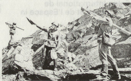
Bild 6. Boden-Luft-Flugkörper Sa-7 (Grail) – Ausbildung im Gebirge. Der Abschuss erfolgt von der Schulter. Maximale Höhe bis 3000 m, Geschwindigkeit Mach 0,7. Einsatz nur gegen langsam fliegende Flugziele und Hubschrauber.

Die grosse Abhängigkeit vom Gelände bedingt, dass es verschiedene Gliederungsformen für Kompanien und Bataillone gibt. Wichtig allein ist die Fähigkeit, den Abschnitt vollständig mit Feuer zu belegen . Jeder Punkt muss von mehr als einer Stelle wirksam unter Feuer genommen werden können. Grundsätzlich sind alle Stützpunkte zur Rundumverteidigung vorzubereiten. Zwischenräume und Lük-