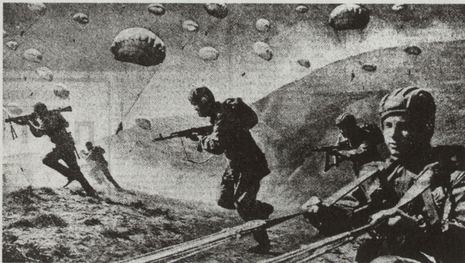
Bild 3. Fallschirmjäger landen im Rücken des Gegners. Die Ausnutzung der dritten Dimension, bedingt durch die Zunahme der Hubschrauber, gibt dem Gebirgskampf ein neues Gesicht.