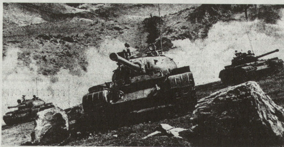
Bild 9. Panzer T-62 beim Einsatz im Gebirge.

– Das Panzerregiment wird in der Regel in der zweiten Staffel oder der allgemeinen Reserve eingesetzt. Es erhält den Auftrag, sich anbahnende Erfolge auszuweiten und wichtige Punkte oder Abschnitte, Pässe, Ortschaften, Höhen oder Strassenknotenpunkte zu nehmen, wenn das Gelände es zulässt. – In der Verteidigung sind Panzer vor allem für die Durchführung von Gegenangriffen vorgesehen, die vorher genau erkundet werden. Dies ist möglich, wenn Täler, Flussbetten oder seichte Gewässer vorhanden sind. Das Panzerregiment wird in der Tiefe der Verteidigung bereitgehalten, wo es die Panzerabwehr verstärkt oder Gegenangriffe führt.