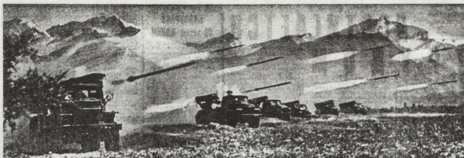
Bild 11. 122-mm-BM-21-Mehrfachraketenwerfer in Feuerstellung. Reichweite 11 km.

- Zur Erhaltung einer hohen Angriffsgeschwindigkeit, zum Besetzen wichtiger Abschnitte, von Höhen, Pässen, Strassenknotenpunkten, zum Überwinden von Wasser- und sonstigen Hindernissen und anderem mehr müssen Motorschützen ständig bereit sein, auf Hubschraubern verlastet zu werden und taktische Luftlandungen durchzuführen. Im Gebirge lässt sich jede Luftlandung ungesehen vom Gegner vorbereiten und die Hubschrauber finden Anflugwege, in denen die gegnerische Luftabwehr nur schwach oder gar