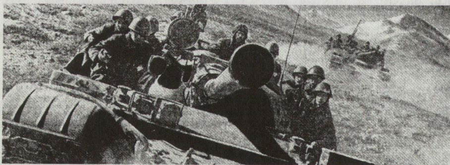
Bild 2. Mot-Schützen, aufgesessen auf Panzern T-62. Dieses Aufsitzen, bei den Sowjets sehr beliebt, spart Kräfte für den Angriff. Hier befinden sich die Mot-Schützen in der Annäherungsphase.

Ein Angriff im Gebirge erfolgt in der Regel aus unmittelbarer Berührung mit dem Gegner. Er wird normalerweise in verschiedenen Richtungen, vorwiegend entlang von Strassen, Wegen und Pfaden, Tälern und Gebirgskämmen durchgeführt. Die Schwierigkeiten des Geländes werden es häufig notwendig machen, die Entscheidung nicht frontal, sondern mit Hilfe von Umgehungen und Umfassungen zu suchen . Der Einsatz von taktischen Luftlandetruppen erhält von Jahr zu Jahr grössere Bedeutung. Allerdings kann in grossen Tälern, im Vorgebirge und wenn eine genügend grosse Anzahl von Wegen vorhanden ist, der Angriff wie unter normalen Bedingungen geführt werden.