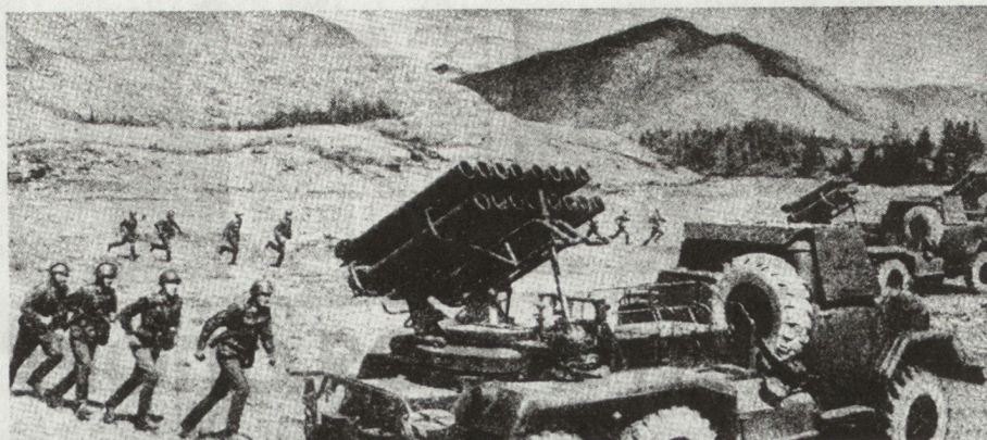
Bild 4. Mehrfachraketenwerfer BM-14. Ein veralteter Werfer mit 16 Rohren, montiert auf dem LKW Zil 151. Reichweite ungefähr 10 km. Es wird bezweifelt, ob Mehrfachraketenwerfer im Gebirge besonders wirksam sind.

Eines der wirksamsten Mittel, solche Verteidigungsstellungen zu überwinden, sind Umgehungsabteilungen . Ihr Auftrag ist es, im Rücken oder an den Flanken der gegnerischen Verteidigung befindliche beherrschende Höhen, Übergänge über Schluchten, Pässe sowie besonders wichtige Abschnitte und Objekte in Besitz zu nehmen und das Heranführen von Reserven beziehungsweise die Verlegung seiner Kräfte von einem Abschnitt zum anderen zu verhindern.