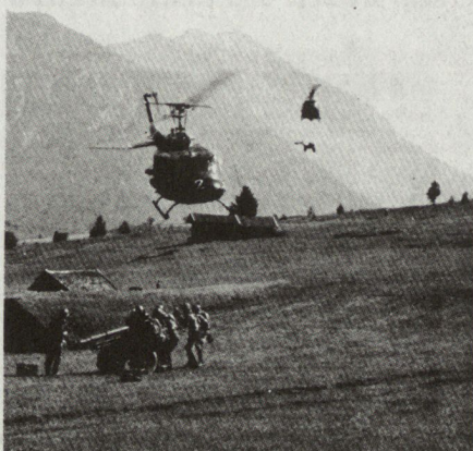
Bild 12. Hubschrauber transportieren Haubitzen 122 mm in die Nähe ihrer vorgesehenen Feuerstellungen.

- Die vielseitigste Verwendbarkeit von Hubschraubern liegt auf dem Gebiete des Transportes . Hier können sie Truppen verlegen, um damit neue Schwer- oder Brennpunkte zu schaffen, sie transportieren Waffen und Munition, Ersatzteile, Verpflegung und Wasser und was auch immer der Gebirgsjäger benötigt. Sie schaffen Verwundete und Kranke fort. Kurz: wo das Transportproblem am schwierigsten ist, hilft der Hubschrauber am wirkungsvollsten; nämlich im Gebirge.