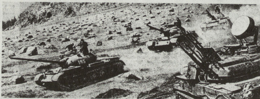
Bild 10. Eine Panzereinheit, ausgerüstet mit Panzern T-55, beim Marsch im Gebirge. Die Fliegerabwehr übernehmen ZSU-23-4.

Insgesamt sind die Möglichkeiten, Panzer im Gebirge wirkungsvoll zu verwenden, stark eingeschränkt. Das Gebirge schreibt Freund und Feind den Einsatz vor, und grosse Unterschiede gibt es nicht. Es muss noch einmal festgehalten werden, dass die Sowjets Meister des Improvisierens sind, die Überraschung überall anstreben und in der Anwendung verschiedenster Tricks und Listen tatsächlich Grosses leisten.