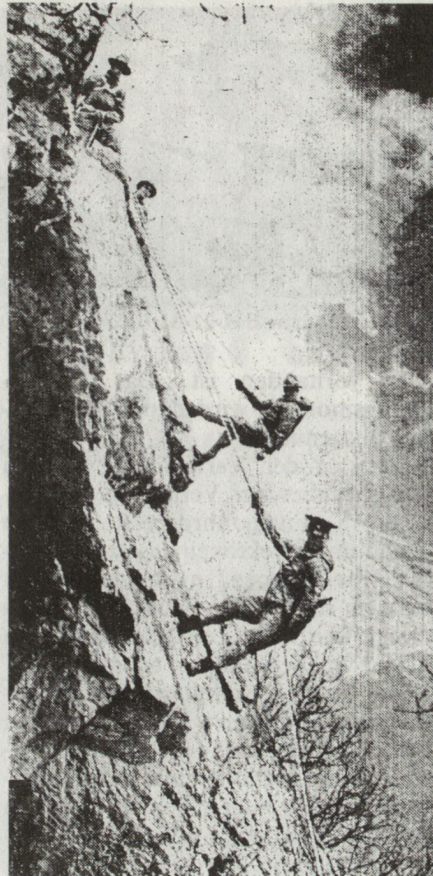
Bild 13. Hochgebirgsausbildung sowjetischer Mot-Schützen.

- Die Kletterausbildung endet mit der Besteigung eines Prüfungsgipfels, der eine Höhe «von einigen tausend Metern» hat. Dabei müssen die Soldaten mit steilen, grasbewachsenen und schneebedeckten Hängen, Geröllfeldern, Felsen und Gletschern fertig werden. Auf dem Gipfel wird ihnen das Abzeichen «Alpinist der UdSSR» überreicht.