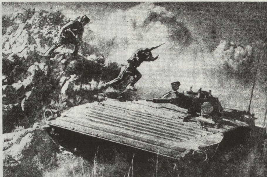
Bild 15. BMP-Schützenpanzer im Gebirge. Sie sind als Transportfahrzeuge oft wichtiger denn als Feuerkraft.

Der sowjetische Soldat bringt eine Reihe von Eigenschaften mit, die ihm beim Gebirgsgefecht sehr behilflich sind. Er ist sehr naturverbunden, anspruchslos und instinktsicher. Er kann sich jedem Gelände anpassen und dieses zu seinem Vorteil ausnutzen. Dem Wetterunbill gegenüber, wie Frost, Kälte und Hitze, Regen, Matsch und Schneesturm, ist er relativ unbeeindruckt, gegen Hunger und Durst unempfindlich. Der sowjetische Soldat ist ein Meister im Tarnen, Schanzen und in der Anwendung von Kriegslisten. Fleiss und Improvisationstalent wurden bereits erwähnt. Er kann ungewöhnlich standhaft und duldsam im Ertragen von Strapazen sein. Zweifellos hat er auch seine Schwächen. Sie treten beim sowjetischen Gebirgs-