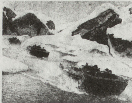
Bild 8. Mot-Schützen überwinden einen Gebirgspass mit ihrem BMP-Schützenpanzer.

– Im Angriff arbeiten Panzer sehr eng mit Mot-Schützen zusammen und werden tatkräftig von Pionieren unterstützt. Der bataillonsweise, kompanie- und sogar zugweise Einsatz wird der Normalfall sein. Das Gelände bestimmt oder begrenzt die Grössenordnung des geschlossen einsetzbaren Verbandes. Auch die Frage, ob Panzer vor den Mot-Schützen angreifen oder ihnen vor allem starke Feuerunterstützung geben, wird in erster Linie vom