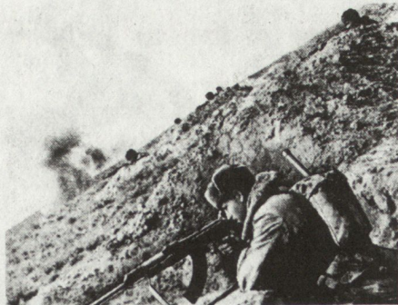
Bild 7. Mot-Schützen bei der Verteidigung im Gebirge. Geübt wird das Schiessen von oben, was von sowjetischen Autoren oft kritisiert wird.

Im Winter sind noch zusätzliche Schwierigkeiten zu überwinden. Steinschlag, Schneelawinen, Unwetter, Schneestürme und niedrige Temperaturen sind normale Erscheinungen, die aber von der Truppe grosse Anstrengungen erfordern. Es müssen Ausweichwege für Märsche auf Skiern erkundet, zusätzliche Kräfte für Aufklärung und Beobachtung eingesetzt und für den Fall einer Einkreisung zusätzliches Gerät und Material bereitgestellt werden. Die Truppe ist grosszügig mit Spezialausrüstung und Bekleidung zu versehen. Nach sowjetischer Ansicht kann ein gut ausgerüsteter und ausgebildeter Soldat im Winter in den Bergen nicht nur widerstehen, sondern auch ihre negativen Faktoren im