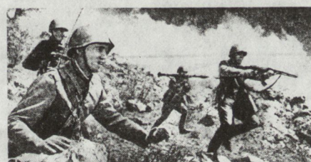
Bild 5. Der Gegner wird vom Rücken her angegriffen.

Umgehungsabteilungen sind nach sowjetischer Ansicht eine Mot-Schützen-Kompanie stark , in selteneren Fällen haben sie Zugstärke. Ihnen werden Pioniere und Soldaten der Chemischen Truppe zugeteilt. Sie werden mit leichten Geschützen, Mörsern und Panzerbüchsen, Sprengmitteln, Minensuchgeräte, Geräten für die chemische und atomare Aufklärung ausgerüstet und besitzen natürlich auch das erforderliche Gebirgszubehör. Sie gehen meist abgesessen vor. Zum Transport von Verwundeten, Munition und der sonstigen Ausrüstung werden zweirädige Handkarren, im Winter Schlitten verwendet.