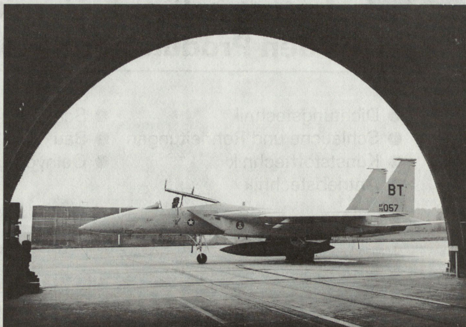
Bild 1. Luftüberlegenheitsjäger F-15 «Eagle» mit 20-mm-Revolverkanone und, für Abfangmission, 4Luft/Luft-Lenk Waffen Sidewinder und 4 Sparrow sowie Aufhängepunkte für 6800 kg Aussenlasten; Mach 2,5 auf 11000 m.

Paktes und der Nato im mitteleuropäischen Raum , ist in der Relation eine 2:1-Überlegenheit des Ostens festzustellen. Nicht nur Quantität, sondern auch Qualität der östlichen Luftstreitkräfte nahmen in den letzten Jahren ständig zu: Neben einer allgemeinen zahlenmässigen Verstärkung von 15% seit 1969 sind auch moderne Flugzeuge der Typen MiG 23, 27 sowie SU 17 und 19 zugeführt worden. Um gerade in Mitteleuropa einigermaßen ausgewogene Kräfteverhältnisse herzustellen, ist gegenwärtig die Präsenz der US-Luftwaffe im derzeitigen Umfang unumgänglich. Kleinere US-Verstärkungen erfolgten in jüngster Zeit, werden künftig noch ergänzt und sind auch bei