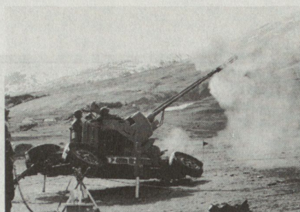
Bild 1. Mehrläufige Schnellfeuerkanonen können, innerhalb ihres Schussbereiches, wirksamer sein als Lenkwaffen (35-mm-Flab-Kan 63).

Was immer für ein Waffensystem zur Luftverteidigung eingesetzt wird, so bleibt doch die möglichst frühe Entdeckung und Erkennung eines Ziels von primärer Wichtigkeit, wenn die zur Abwehr bereitgestellten Waffen zeitgerecht zum Einsatz kommen sollen. Denn ein mit einer Geschwindigkeit entsprechend Mach 1 und in rund 50 Meter Höhe über Grund fliegendes Feindflugzeug lässt der Besatzung eines Flabsystems nur sechs bis sieben Sekunden Zeit für den Einsatz. Gewiss müssen zur immer mehr an Bedeutung gewinnenden Bekämpfung tief und