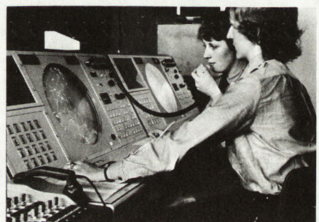
Bild 2. Florida-FHD respektive Luftlagesprecherinnen