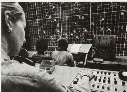
Bild 1. FHD des Fl BMD in der Auswertezentrale

Beim Kommando der Flieger- und Flabtruppen ist man sich jedoch darüber im klaren, daß der «Einbruch» der Frau in eine bisher fast vollständig männliche Welt nicht ohne Probleme vor sich gehen wird. Die Wehrmänner werden lernen müssen, die Frau in der Armee zu akzeptieren und auch ihr eine Aufstiegschance zu geben. Aufgrund der gemachten Erfahrungen wird aber jede Frau von dem Augenblick an akzeptiert, wo Können und Einsatzwillen vorhanden sind, wie übrigens im Zivilleben auch. Die