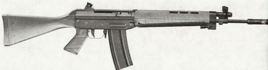
Bild 1. SG 540, Kaliber 5,56 mm, mit festem Kolben, angeklappter Stütze und Dreißigschußmagazin.

Handschutzober- und -unterteil, der Pistolengriff und der Kolben der handlichen Waffe bestehen aus schlagfestem Kunststoff. Verschuß- und Abzugshäuser, letzteres übrigens abklappbar, bestehen aus formgestanztem Stahl-