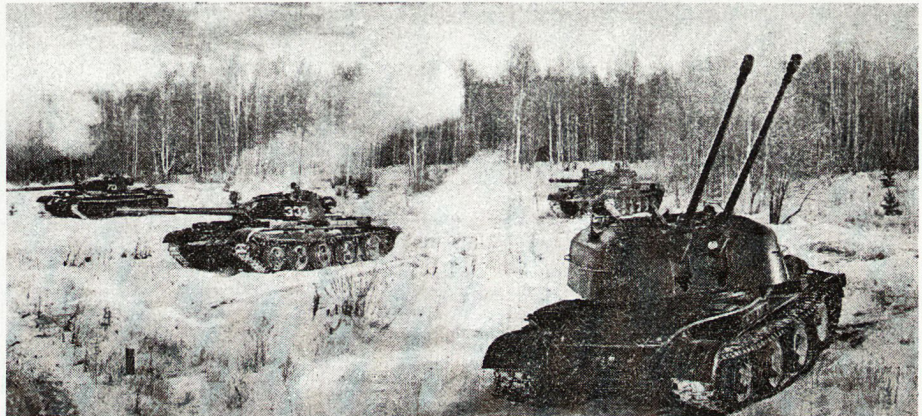
Bild 5. Panzer und Fliegerabwehr bei Ausweitung des Brückenkopfes (T62 und ZSU 57/2).

liegen. Alle Möglichkeiten, die Stellungen durch den Einsatz von Pionieren zu verstärken, müssen ausgenützt werden. Minensperren sind ständig zu überwachen; auf solide Tarnung sei besonders zu achten.