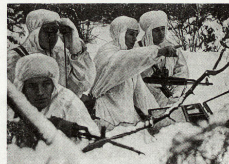
Bild 1. Die Fähigkeit, sich jedem Gelände und jeder Witterung anzupassen, ist eine der herausragenden Eigenschaften der sowjetischen Soldaten.

So hat die sowjetische militärische Führung die Voraussetzungen geschaffen, die es ihr erlauben, ihre hohen Forderungen an die Truppe auch für Winteroperationen und Wintergefechte zu stellen.