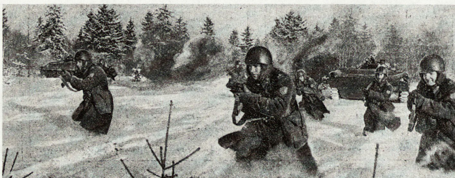
Bild 2. Panzer und Motorschützen im Winterkampf.

Die Berücksichtigung dieser Faktoren eines Gefechts unter winterlichen Bedingungen findet in den sowjetischen Führungsvorschriften ebenso wie in zahlreichen Artikeln der militä-