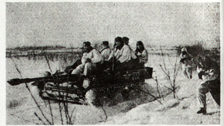
Bild 3. Sowjetische Luftlandetruppen, aufgefressen auf dem ASU 57.

- Die Schneedecke erhöht die Wirkung atomarer Einsatzmittel . Die