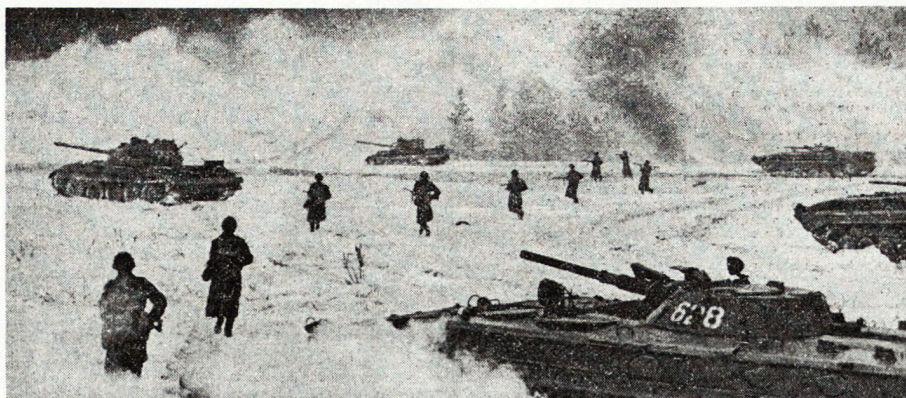
Bild 7. Panzerbrechende Abwehrwaffen zwingen die Motorschützen abzusetzen.

stungen die hohen Forderungen ihrer Führung wie selbstverständlich erfüllen zu können. Gerade im Winter fühlen sich die sowjetischen Soldaten allen anderen gegenüber überlegen.