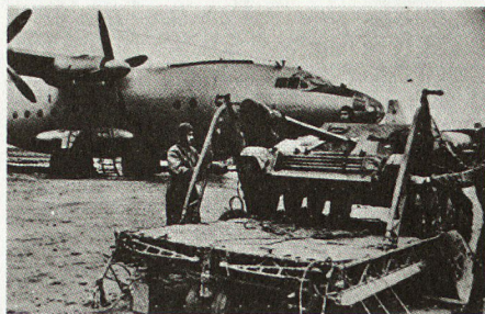
Bild 2. ASU57 werden für Abwurf aus AN12 vorbereitet.

Insgesamt gesehen: eine ausgewogene Gliederung, die die besonderen Gegebenheiten von Luftlandungen berücksichtigt, bei der auch alle moder-