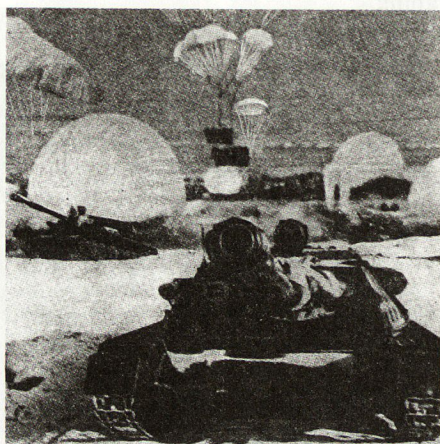
Bild 7. Der Panzer ASU85 muß mit Flugzeugen gelandet werden; übriges Material wird mit Fallschirmen abgeworfen.

Ähnlich ist die Frage nach operativen Luftlandungen zu beurteilen.