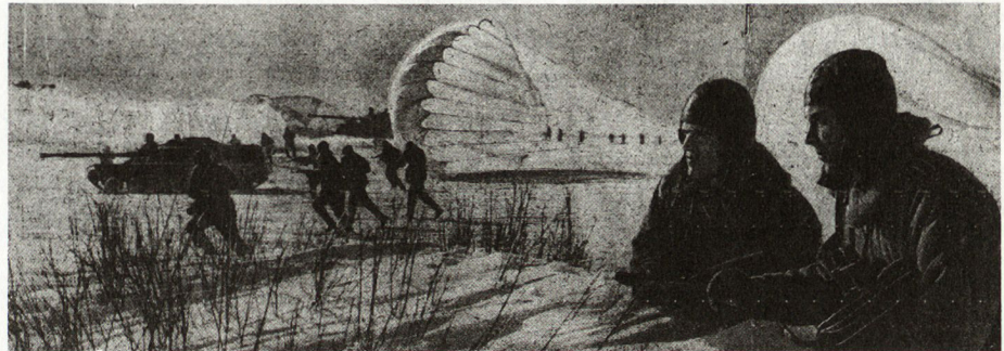
Bild 5. Sofort nach Landung gehen Fallschirmjäger, unterstützt von Panzern ASU57, zum Angriff über.