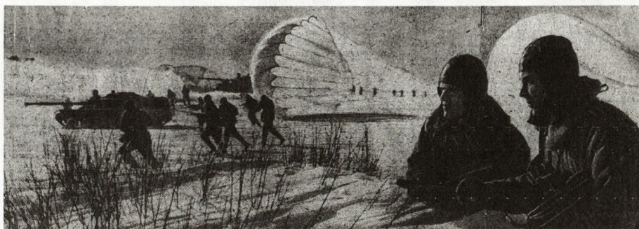
Bild 5. Sofort nach Landung gehen Fallschirmjäger, unterstützt von Panzern ASU57, zum Angriff über.