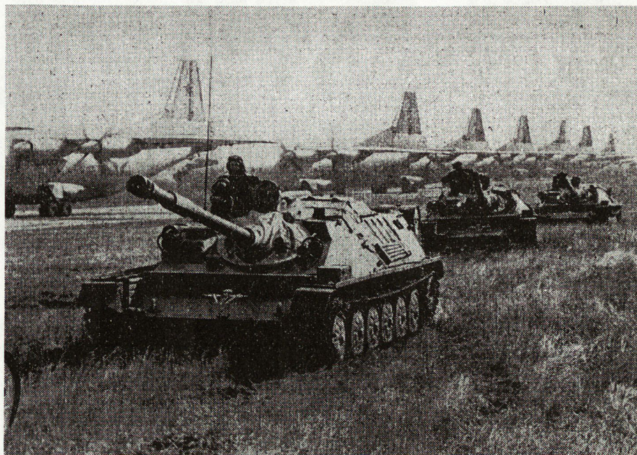
Bild 1. Der ASU85, die schwerste Waffe der Luftlandetruppen, beim Verlad in Transportflugzeuge AN12.

«Im September 1943 wurden größere Luftlandeunternehmen (zwei Brigaden) in der Ukraine bei Kiew, Kanew und Tscherkassy versucht, gingen aber übel aus.»