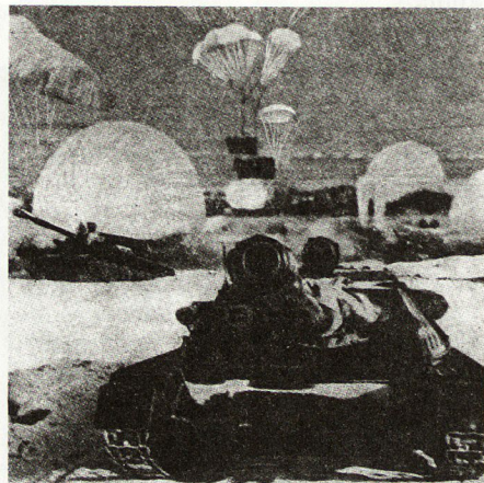
Bild 7. Der Panzer ASU85 muß mit Flugzeugen gelandet werden; übriges Material wird mit Fallschirmen abgeworfen.

Ähnlich ist die Frage nach operativen Luftlandungen zu beurteilen.