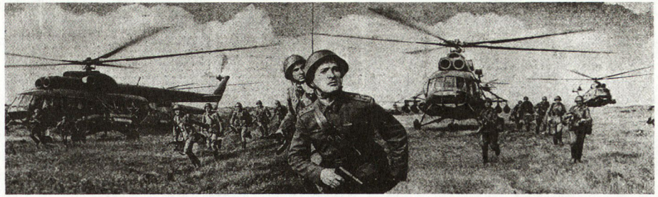
Bild 4. Schwere Transporthubschrauber (Mi6 «Hook») landen Motorschützen in der Tiefe des Gefechtsfeldes. Vorn Kompaniechef (Hauptmann).

Selbstverständlich gibt es noch eine Reihe anderer Typen. Erwähnenswert ist, daß die Sowjets in jüngster Zeit sehr große Fortschritte bei der Entwicklung von Kampfhubschraubern gemacht haben, die sehr wohl in der Lage sind, Luftlandungen aus der Luft zu unterstützen.