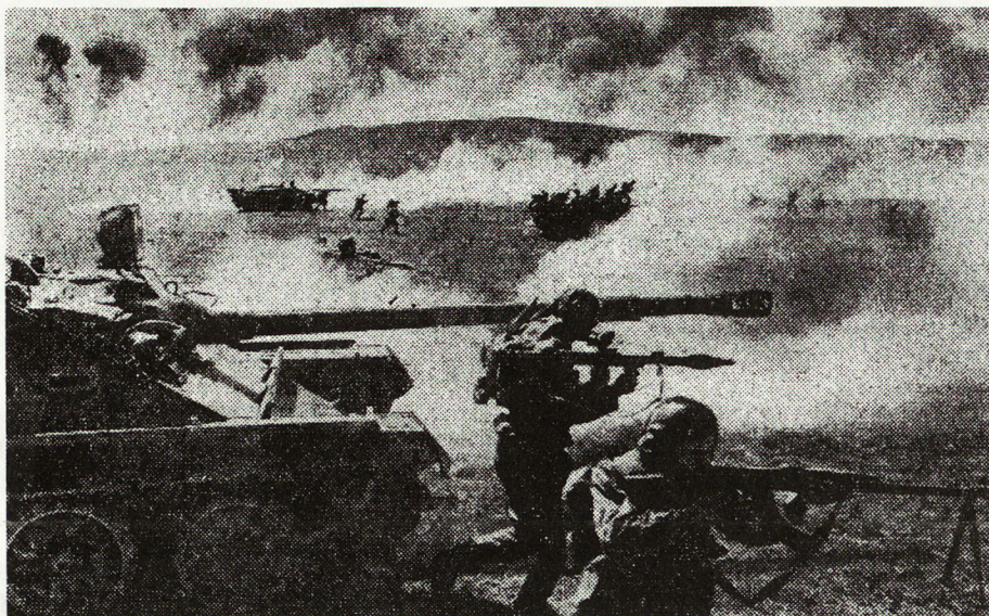
Bild 6. Luftlandetruppen im Angriff.