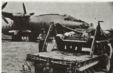
Bild 2. ASU57 werden für Abwurf aus AN 12 vorbereitet.

Insgesamt gesehen: eine ausgewogene Gliederung, die die besonderen Gegebenheiten von Luftlandungen berücksichtigt, bei der auch alle moder-