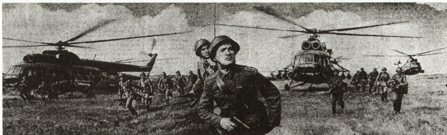
Bild 4. Schwere Transporthubschrauber (Mi6 «Hook») landen Motorschützen in der Tiefe des Gefechtsfeldes. Vorn Kompaniechef (Hauptmann).

Selbstverständlich gibt es noch eine Reihe anderer Typen. Erwähnenswert ist, daß die Sowjets in jüngster Zeit sehr große Fortschritte bei der Entwicklung von Kampfhubschraubern gemacht haben, die sehr wohl in der Lage sind, Luftlandungen aus der Luft zu unterstützen.