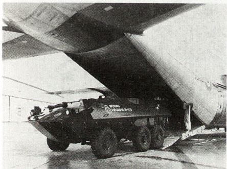
Bild 6. Ein «Piranha» 6x6 beim Verlassen eines Transportflugzeuges.