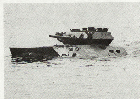
Bild 4. Angetrieben durch zwei große Schrauben, erreichen die Mowag «Piranha» Wasserfahrgeschwindigkeiten von bis zu 12 km/h.