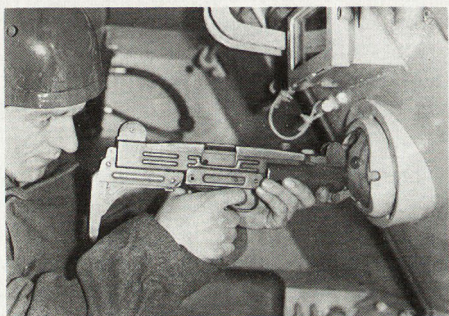
Bild 2. Weltweit patentierte Mowag-Kugelblende in geöffnetem Zustand mit eingesetzter Maschinenpistole.