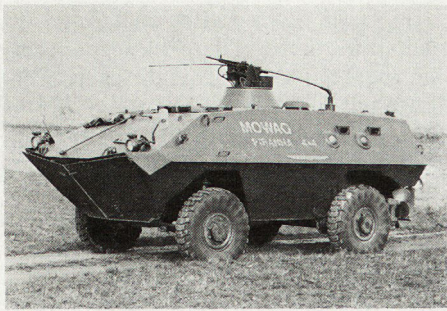
Bild 1. Mowag-«Piranha» 4x4 mit scheidellafettiertem Maschinengewehr 7,62 mm. In der Seitenwand sichtbar zwei Kugelblenden. Sowohl Scheidellafette als auch Kugelblenden wurden von der Mowag entwickelt und in großen Stückzahlen an verschiedene Armeen geliefert. Diese Waffenhalterungen erlauben den gezielten Feuerkampf aus dem komplett geschlossenen Fahrzeug, das heißt unter vollem Panzer- und ABC-Schutz.