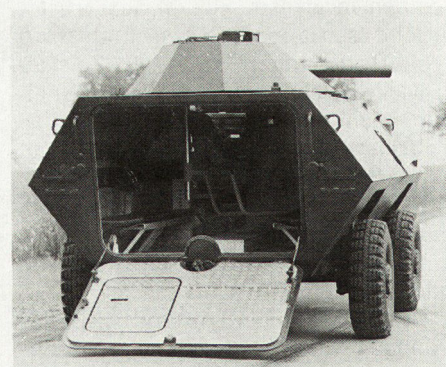
Bild 3. Blick in den geräumigen Kampfraum der «Piranha» 4x4. Hier in der Mehrzweckausführung als Panzeratrasse, Markier-, Ambulanz- und Transportfahrzeug mit großer Heckklappe.

Ohne Zweifel ist den Mowag-Ingenieuren mit der «Piranha»-Radpanzerfamilie eine aussichtsreiche Entwicklung geglückt.