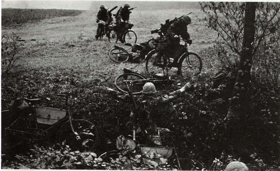
Bild 8. Menschenführung ist kein Katalog von guten Eigenschaften, sondern eine Rolle in der Gruppe. Für die meisten Probleme gibt es nicht nur eine Antwort. Der Vorgesetzte muß lernen, den Führerstil zu wählen, der ihm für die Erfüllung seines Auftrages am besten erscheint.

auf welche Art und Weise er mit seinen Männern Kontakt pflegen muß, wie er seine Männer zur Kontaktpflege mit ihm veranlaßt und wie Informationen in Entscheidungen und Entscheidungen in die Tat umzusetzen sind.