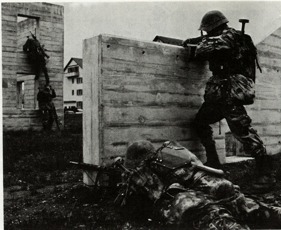
Bild 10. Charakteristische Merkmale, die Erfolg und Mißerfolg der militärischen Menschenführung anzeigen: Disziplin, Leistung, Moral und Korpsgeist.

Der Korpsgeist macht den individuellen Wert einer Einheit aus und bringt ihren Willen zum Ausdruck, trotz anscheinend unüberwindlichen Widrigkeiten zu kämpfen und zu siegen. Der Korpsgeist hängt ab von der Zufriedenheit der Soldaten über ihre Zugehörigkeit zur Einheit, von ihrer Haltung gegenüber anderen Angehörigen der Einheit und ihrem Vertrauen zu ihren Vorgesetzten. Zur Bewertung des Korpsgeistes gehören Äußerungen, die den Stolz auf die Einheit ausdrücken, Wettbewerbsgeist wecken usw.