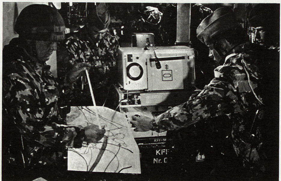
Bild 9. Die Armee erwartet Auftragserfüllung und Leistung. Der Soldat erwartet Anerkennung, sinnvolle Arbeit und faire Behandlung.

Die Moral der Truppe kann ein Vorgesetzter durch intensive Beobachtung