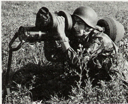
Hauptposition des Rüstungsprogramms 1977: 395 Millionen Franken kostet die Erstbeschaffung von Panzerabwehrlenk Waffen Boden/Boden 77 («Dragon»).

– Mittlere Gabelstapler für die Versorgungsformationen. Das zur Beschaffung vorgeschlagene Modell ist in der Armee bereits eingeführt und hat sich im Einsatz bewährt.