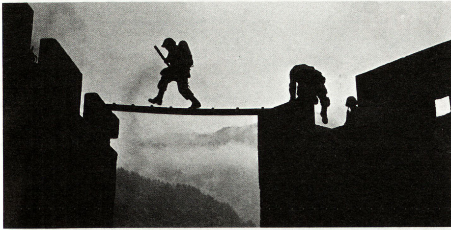
Bild 3. Mut ist eine geistige Eigenschaft, die einem Soldaten die Kontrolle über die Angst verleiht.