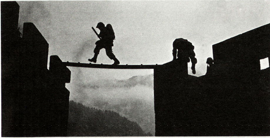
Bild 3. Mut ist eine geistige Eigenschaft, die einem Soldaten die Kontrolle über die Angst verleiht.