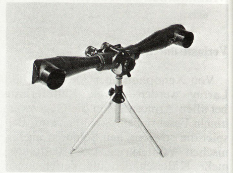
ewe Bild 2. Scherenfernrohr gespreizt, für beste stereoskopische Tiefenwirkung.

ranzen ist dafür gesorgt, daß dieser Fehler im Gebrauch nicht auftritt. Dank der guten Abdichtung werden auch Regen und Schnee keinen nachteiligen Einfluß haben.