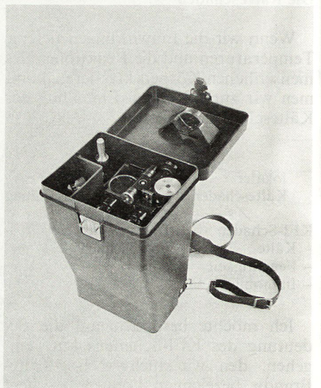
Bild 3. Fernrohr und Kleinstativ, in Tragbehälter verpackt.

Es ist zu erwarten, daß das leichte, handliche Gerät bald eine wertvolle Hilfe für die Truppe sein wird. ■