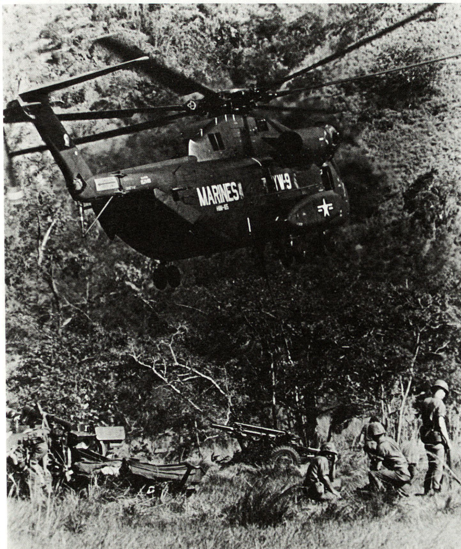
Bild 3. Einflug der Artilleriegeschütze mit Helikopter H53 («Sea Stallion»).

wurde im Oktober 1966 ein derartiger Artilleriefeuerüberfall mit 4 Haubitzen ausgeführt, die 280 Schuß innerhalb von 17 Minuten verschossen und wieder ausgeflogen wurden.