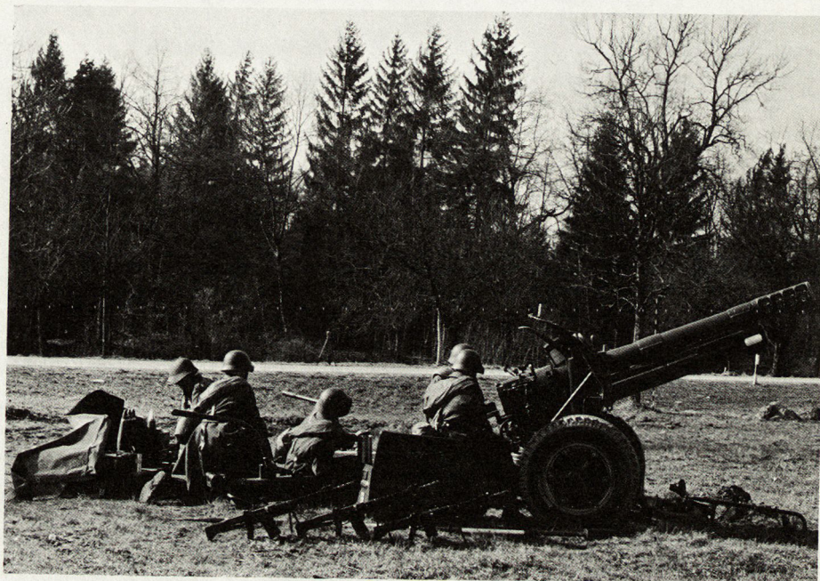
10,5-cm-Haubitze bei der ersten Scharfschießübung in einer Rekrutenschule.

Die mobile Artillerie darf behaupten, sie löse die Nahverteidigungsaufgaben je länger, je besser. Oft kann sogar fest- gestellt werden, daß der Einsatz der entsprechenden Mittel über bestimmte Zeiten zu umfangreich ist, wenn man den Gesamtauftrag betrachtet. Auch die Artillerie wird nicht darum herum- kommen, eine gewisse Ökonomie der Kräfte zu betreiben. Dies drängt sich bei ihrem eher knappen Personalbe- stand auf. Mir scheint, daß es vor allem gilt, die Verbindungen zu vorgesetzten und benachbarten Kommandostellen besser auszunützen und der Lage ange- paßte Bereitschaftsstufen konsequen- ter anzuwenden. Damit die bei den größer gewordenen Kampfräumen und den oft abreißen Verbindungen ent- stehenden unübersichtlichen Lagen im Stellungsraum besser pariert werden