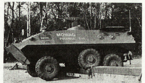
Transportpanzer «Piranha 6 × 6», Prototyp 1974.