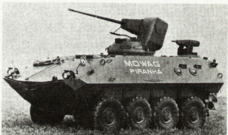
Transportpanzer «Piranha 8 × 8», Prototyp 1974, mit 25-mm-BMK in Einmannurm. ■