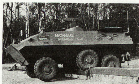
Transportpanzer «Piranha 6 × 6», Prototyp 1974.

Die «Piranha»-Fahrzeuge erreichen mit einer Leistung von 26 bis 31 PS/t eine Spitzengeschwindigkeit von 100 km/h. Bei den Achsen sind die Differenziale elastisch in der Wanne gelagert. Der Vorderachsenantrieb ist abschaltbar, automatische Lamellensperrdifferenziale sind vorhanden. Die Räder sind einzeln aufgehängt. Die Reifengröße Michelin ist 11.00 × 16 XL mit schußsicheren Einlagen Hutchinson. Die Federung mit Drehstab und Spiralfeder hat einen Federweg von 320 bis 340 mm. Hydraulische Stoßdämpfer wirken auf alle Räder. Eine drucklufthydraulische Zweikreisbremse ist vorhanden. Die Kraftstoffbehälter fassen 275 l beim 4 × 4, beim 6 × 6 und 8 × 8 je 300 l. (Nr. 10/1974) (gg)