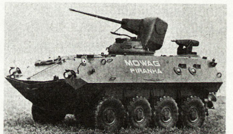
Transportpanzer «Piranha 8 × 8», Prototyp 1974, mit 25-mm-BMK in Einmanturm. ■