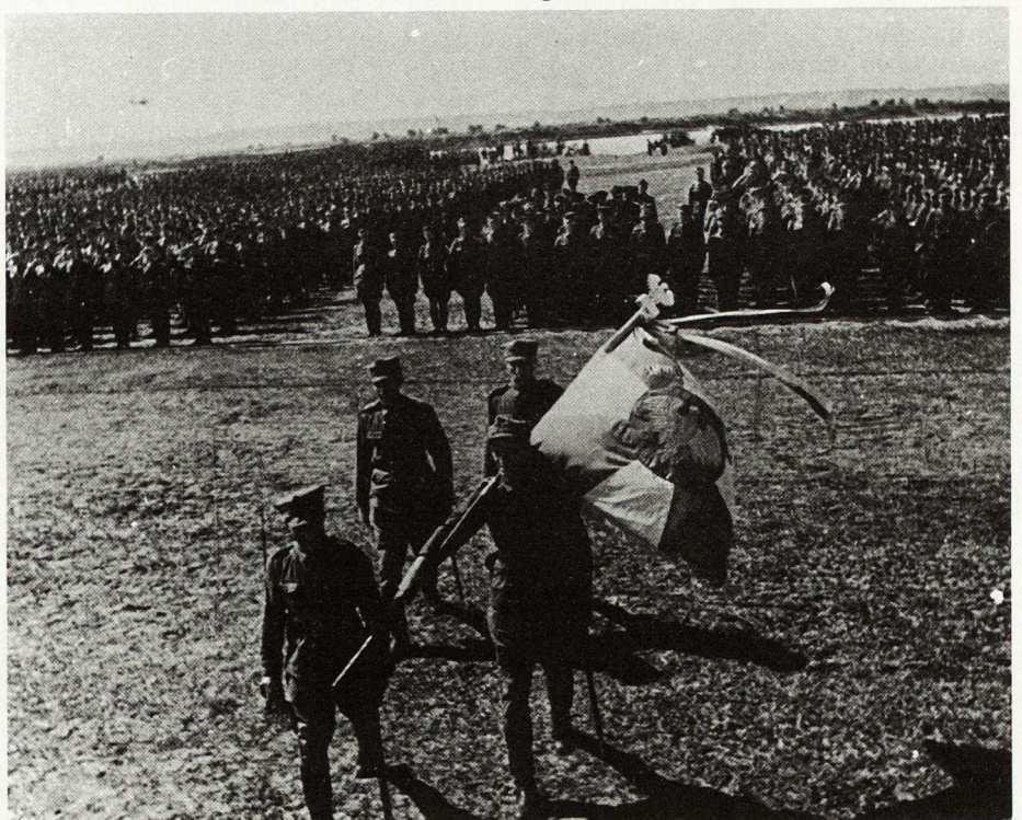
Bild 1. Eid der Kosciuszko-Soldaten im Sielce-Lager an der Oka (1943)