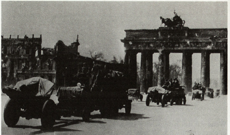
Bild 2. Polnische Artillerie vor dem Brandenburger Tor (Mai 1945)

Die Haltung des polnischen Volkes sowie die Aktivität der Partisanen im Hinterland der Ostfront zwangen den Okkupanten zeitweise zur Stationierung von 600000 bis 800000 Soldaten