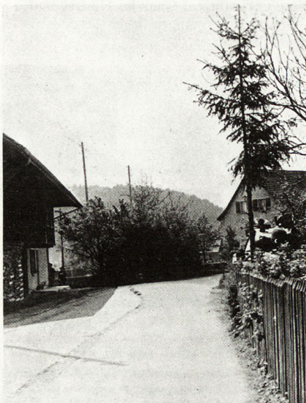
Bild 2. Blick in den zu nehmenden Dorfteil kurz nach Beginn des Angriffs. Die vordersten Grenadiergruppen sind bereits ein oder zwei Häuser weiter vorgestoßen.

Unser Bataillon lag seit einigen Tagen im Raume Thun–Seftigen–Blumenstein–Gwatt–Thun, mit dem Auftrag, seinen Raum zu behaupten. Im Morgenrauen des Tages X wurden bei A-Dorf feindliche Truppen helitransportiert gelandet. Man schätzte minde-