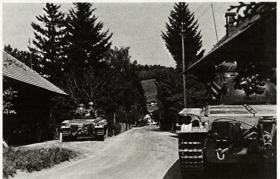
Bild 4. Die beiden Panzer in Feuerstellungen gegen Ende der Aktion. Der hintere Panzer kann den vorderen decken und gleichzeitig die Grenadiere unterstützen. Ganz im Hintergrund ist noch ein Schützenpanzer teilweise sichtbar. Zwei Grenadiergruppen liegen ein oder zwei Häuser vor den Panzern, zwei andere unmittelbar um die Panzer.

Eingefleischte Panzerkommandanten werden kaum Begeisterung empfinden, wenn Panzer in einem für sie gefährlichen Gelände, wie es Ortschaften sind, eingesetzt werden. Ich teile diese Skepsis, und wir werden den Ortskampf mit Panzern sicher nicht suchen. Aber ich bin überzeugt, daß wir diese Kampfweise üben müssen. Denn es ist auf alle Fälle besser, eine Kampfweise zu kennen und sie nicht zu brauchen, als eine Kampfweise nicht zu kennen, wenn man sie braucht. Dieser Artikel wurde deshalb mit der Nebenabsicht geschrieben, zur Diskussion anzuregen.