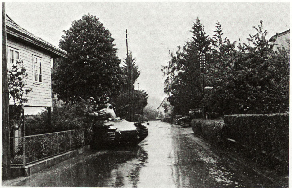
Bild 3. Ein Panzer in Feuerstellung; links am Haus die hinterste Grenadiergruppe.

stens Zugstärke, wobei zwar panzerbrechende Waffen, jedoch kaum schwere Mittel zu erwarten waren. Der Gegner war voraussichtlich noch nicht fest eingerichtet und dürfte seine Schwierigkeiten mit der Zivilbevölkerung oder ortsansässigen Truppen haben. Die Kp . /27 (– 1 Pz Gren Z, + 1 Pz Z) wurde sofort mit folgendem Auftrag eingesetzt: