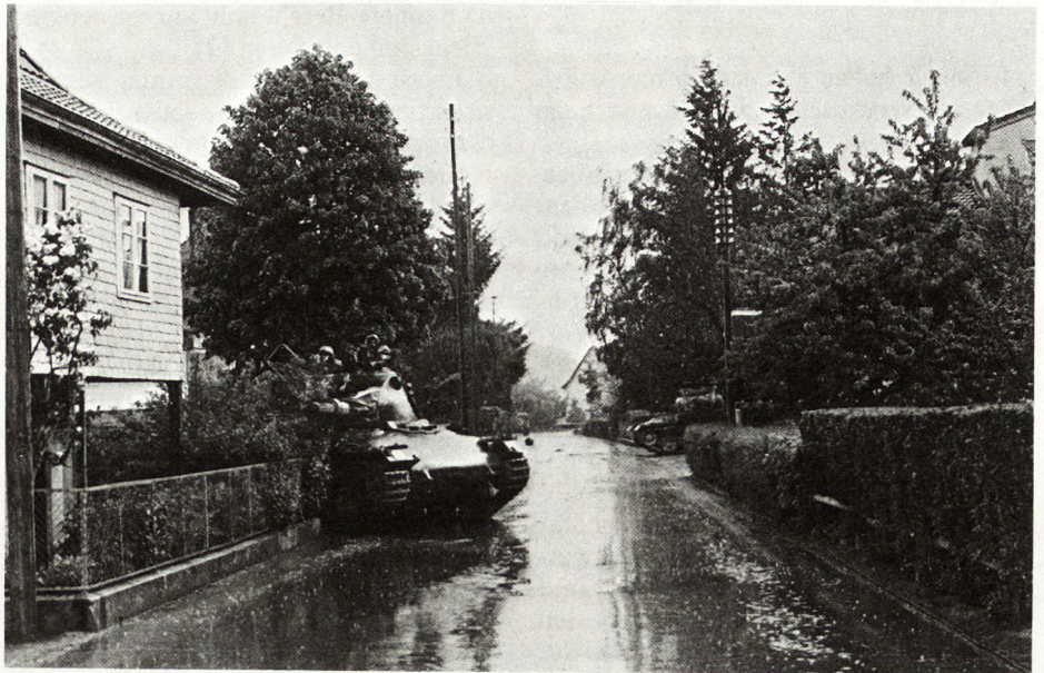
Bild 3. Ein Panzer in Feuerstellung; links am Haus die hinterste Grenadiergruppe.

stens Zugstärke, wobei zwar panzerbrechende Waffen, jedoch kaum schwere Mittel zu erwarten waren. Der Gegner war voraussichtlich noch nicht fest eingerichtet und dürfte seine Schwierigkeiten mit der Zivilbevölkerung oder ortsansässigen Truppen haben. Die Kp ./27 (- 1 Pz Gren Z, + 1 Pz Z) wurde sofort mit folgendem Auftrag eingesetzt: