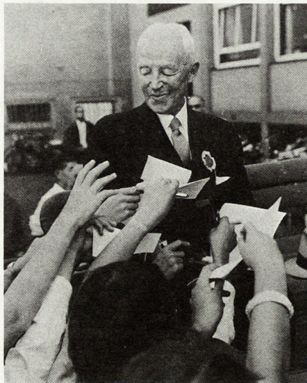
General Guisan als Ehrengast in Basel

Den Auftrag, dieses Buch der Erinnerung zu schreiben, habe ich mir selbst gegeben. Lange dachte ich gar nicht daran, einen Verleger ins Vertrauen zu ziehen. Ein Zufall führte mich dann