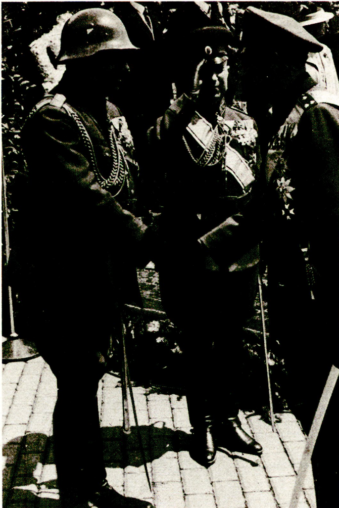
Bild 2. Tag des bulgarischen Heeres, Défilé vor Zar Boris am 6. Mai 1939 in Sofia. Zar Boris (rechts) im Gespräch mit dem Inspekteur der Armee, General Lukasch (links), Verteidigungsminister, General Daskaloff (Mitte).

die aufgezwungene rote Regierung zu stürzen. Alle wurden verurteilt, verhaftet und nach schweren Mißhandlungen umgebracht oder für lange Zeit in Gefängnisse und Zwangsarbeitslager verschleppt.