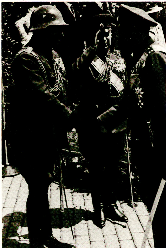
Bild 2. Tag des bulgarischen Heeres, Défilé vor Zar Boris am 6. Mai 1939 in Sofia. Zar Boris (rechts) im Gespräch mit dem Inspekteur der Armee, General Lukasch (links), Verteidigungsminister, General Daskaloff (Mitte).

die aufgezwungene rote Regierung zu stürzen. Alle wurden verurteilt, verhaftet und nach schweren Mißhandlungen umgebracht oder für lange Zeit in Gefängnisse und Zwangsarbeitslager verschleppt.