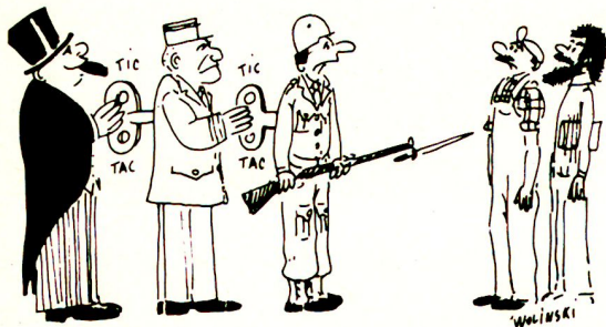
Aus der Flugblattaktion „gegen den Militarismus“ an der Universität Bern.

Wir informieren weiter, beachtet die nächsten Flugblätter!