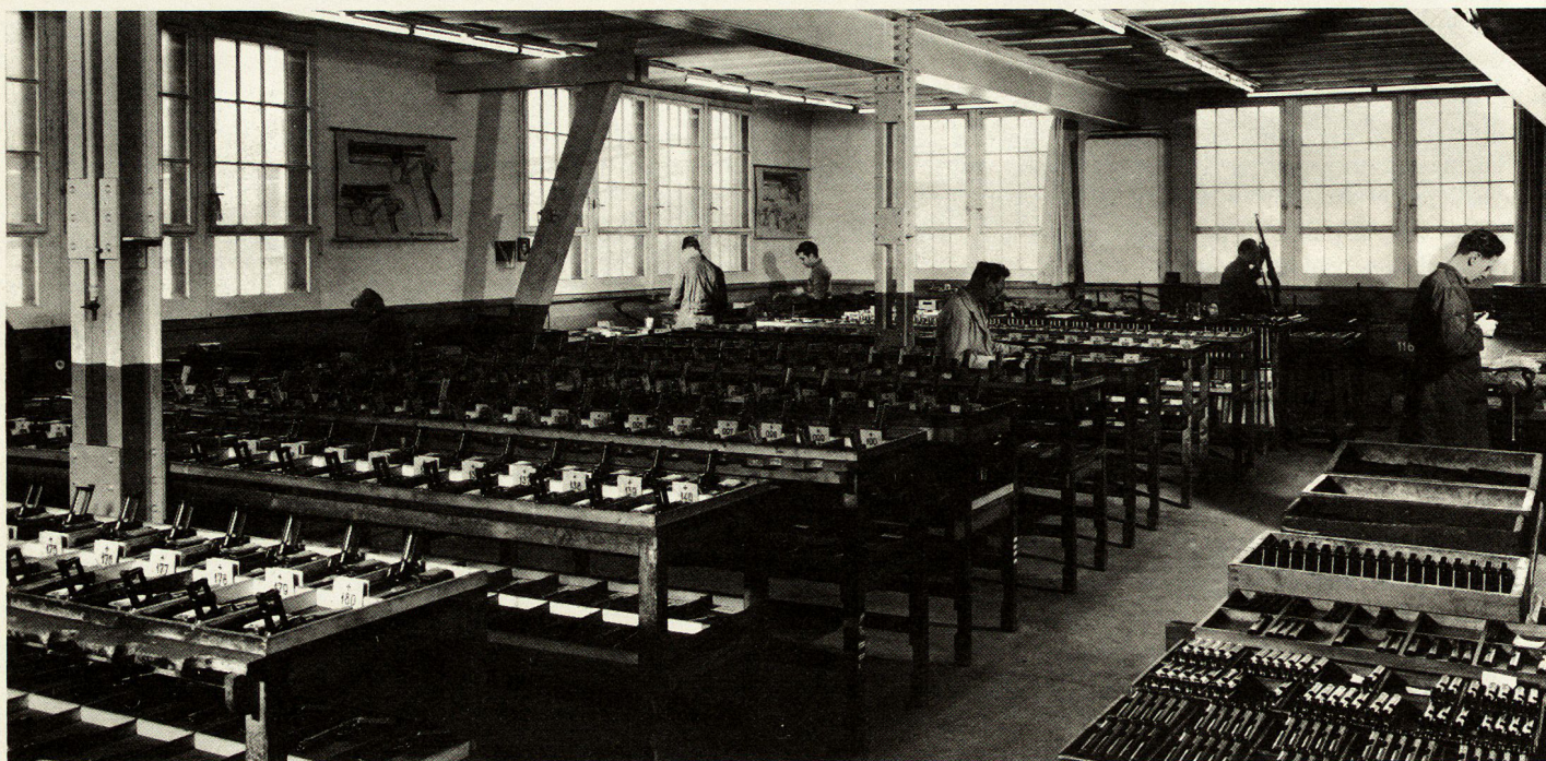
Montage der Armeepistole Modell 49

Nach der Aufdeckung der illegalen Waffenexporte im Jahr 1968 wurde Land auf und ab die Auffassung vertreten, die Kriegsmaterialausfuhr müsse besser kontrolliert und restriktiver gehandhabt werden. Der Bundesrat erließ in der Folge verschärfende Kontrollmaßnahmen. Der Gesetzesentwurf geht jedoch nicht wesentlich darüber hinaus. Er enthält weitgehend die Bestimmungen des gültigen Bundesratsbeschlusses über das Kriegsmaterial nach dem Stand vom 1. November 1970. Eine synoptische Darstellung der beiden Texte ergibt, daß sie sowohl nach Inhalt als auch nach den Formulierungen in vielen Punkten identisch sind. Die Verschärfungen beschränken sich hauptsächlich auf zwei Gebiete: erstens auf die Strafbestimmungen und zweitens auf die Kontrolle, indem bei der Bundesanwaltschaft eine Zentralstelle zur Bekämpfung illegaler Waffengeschäfte eingerichtet wird.