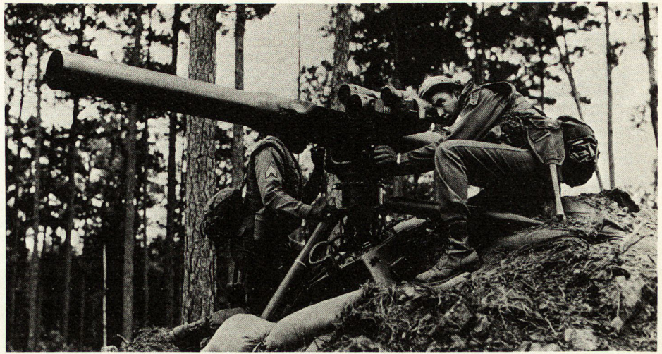
Bild 2. TOW-Lenkwanne, -Rohr und -Feldlafette.

Die TOW-Lenkwanne ist 1,17 m lang, mißt 15,3 cm im Durchmesser und wiegt 18,1 kg. Die maximale Reichweite beträgt 3000 m, die minimale 65 m. Kg.