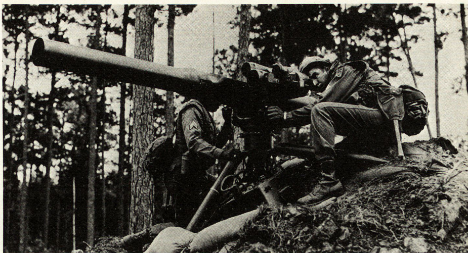
Bild 2. TOW-Lenkwaffe, -Rohr und -Feldlafette.

Die TOW-Lenkwaffe ist 1,17 m lang, mißt 15,3 cm im Durchmesser und wiegt 18,1 kg. Die maximale Reichweite beträgt 3000 m, die minimale 65 m. Kg.