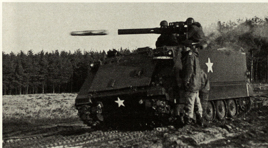
Bild 1. TOW im Schuß ab Schützenpanzer M 113.

Das Geschoss wird durch zwei separate, äußerst kräftige Raketenmotoren angetrieben, wobei der erste Motor das Geschoss aus dem Rohr des Werfers treibt und der zweite aus Sicherheitsgründen erst kurz vor Brennschluß des ersten Motors in Funktion tritt; er verleiht dann dem Geschoss die notwendige Bahngeschwindigkeit.