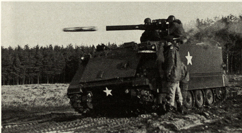
Bild 1. TOW im Schuß ab Schützenpanzer M 113.

Das Geschoss wird durch zwei separate, äußerst kräftige Raketenmotoren angetrieben, wobei der erste Motor das Geschoss aus dem Rohr des Werfers treibt und der zweite aus Sicherheitsgründen erst kurz vor Brennschluß des ersten Motors in Funktion tritt; er verleiht dann dem Geschoss die notwendige Bahngeschwindigkeit.