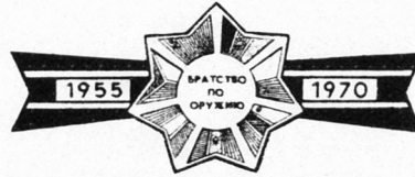
Das Manöverabzeichen «Waffenbrüderschaft».

Vom Motorschützen auf dem Kampfwagen bis zum Piloten in der Stratosphäre waren Tausende Soldaten am Manöver der Vereinten Streitkräfte der Warschauer-Pakt-Staaten unter dem Decknamen «Waffenbrüderschaft» im Oktober 1970 beteiligt. Panzerübungen und Luftlandungen, enges Zusammenwirken auf dem Gefechtsfeld, Einsätze über Räume von Zehntausenden von Quadratkilometern – Schwerpunkte eines Tests, der der Gefechtsbereitschaft dieser Armeen diente. In sieben Sprachen wurden dabei Befehle erteilt, die in eine einheitliche Kommandosprache des Warschauer Vertrages – ins Russische – mündeten.