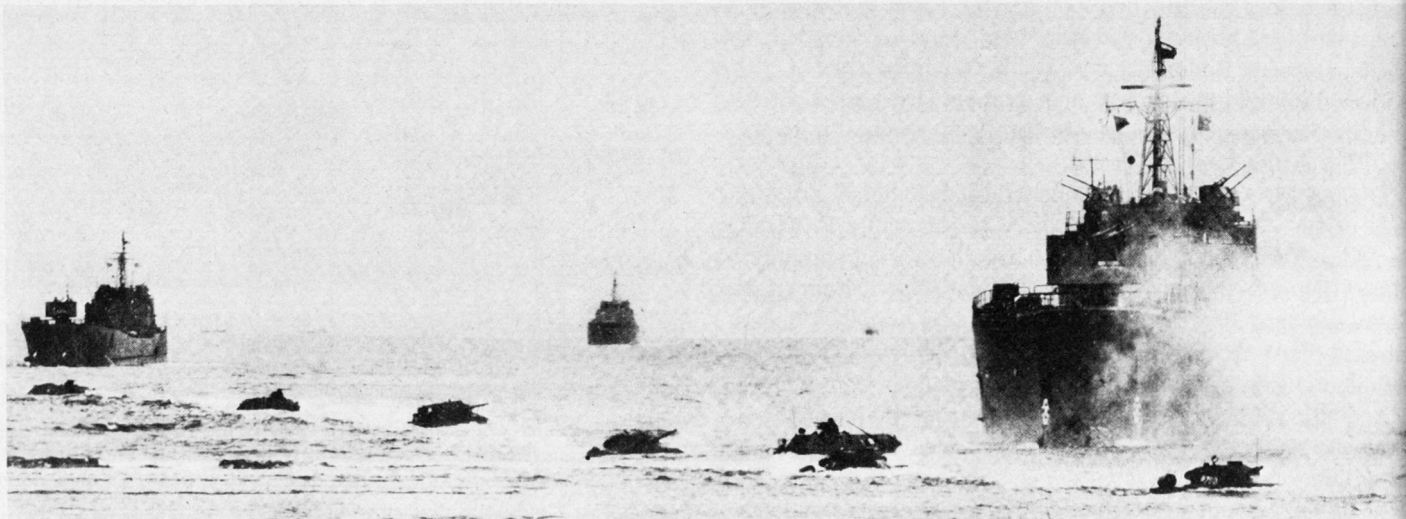
Bild 3. Kombinierte Luft- und Seelandeoperation: Landungsschiffe der Baltischen Rotbannerflotte, der Polnischen Seekriegsflotte und der Volksmarine der DDR setzen Kampfpanzer an der Küste ab.

mit polnischen Einheiten einen Flugplatz des Gegners. Nach dem Abwerfen weiterer schwerer Kampftechnik setzten Verbände der Vereinten Streitkräfte ihren Angriff fort. Sie forcierten ein breites Wasserhindernis. Ferner wurden Hafenanlagen und andere wichtige Objekte des Gegners besetzt 16 .