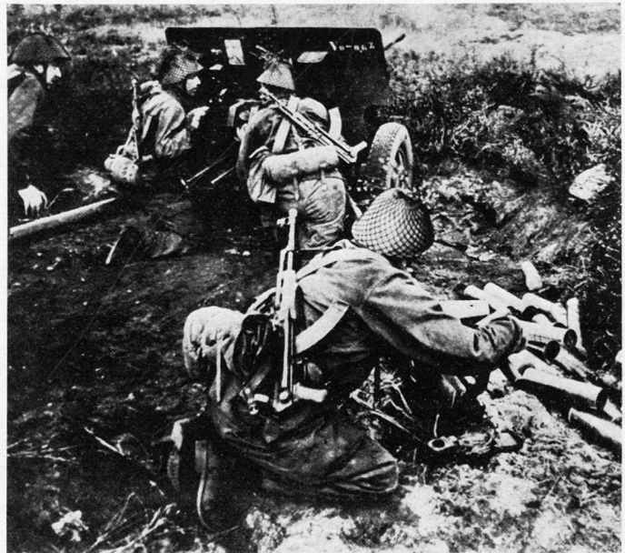
Bild 2. Kampfgruppen-Geschützbedienung: Erstmals nahmen Kräfte der Territorialverteidigung der DDR an einem großen Manöver teil.

Panzerkräfte der Polnischen Armee. Jagdflieger der NVA und Fliegerkräfte der Polnischen Armee, der Sowjetarmee und der tschechoslowakischen Armee mußten Starte in kürzester Zeit sowie Landungen auf einem Befehlsflugplatz durchführen. Nachmittags wurde den Manövergästen ein moderner Gefechtsstand der NVA, der völlig mechanisiert und automatisiert ist, vorgeführt. Bei einem Nachtgefechtsschießen von Panzereinheiten, Raketentruppen und Artillerieeinheiten wurde die Wirkung moderner Waffen demonstriert 15 .