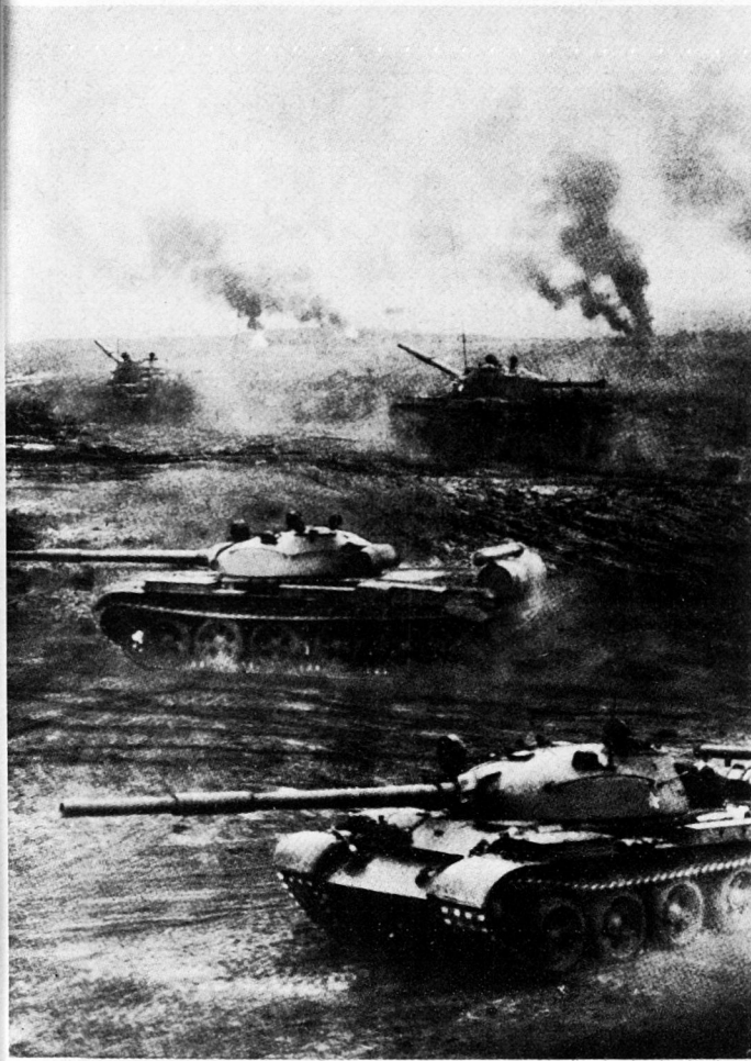
Bild 5. T-62-Panzer der Sowjetischen Besatzungstruppen in der DDR bei einem Angriff.

3. Es gab einheitliche Befehle zur Erfüllung der Kampfaufträge. Jeder Manöverteilnehmer wurde angehalten, die gegebenen Befehle sofort und widerspruchslos auszuführen, ganz gleich durch welchen Kommandeur der teilnehmenden Streitkräfte der Befehl entsprechend der Aufgabenstellung erteilt wurde.