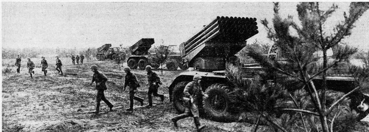
Bild 4. Sowjetischer Mehrfach-Raketenwerfer auf dem Gefechtsfeld.