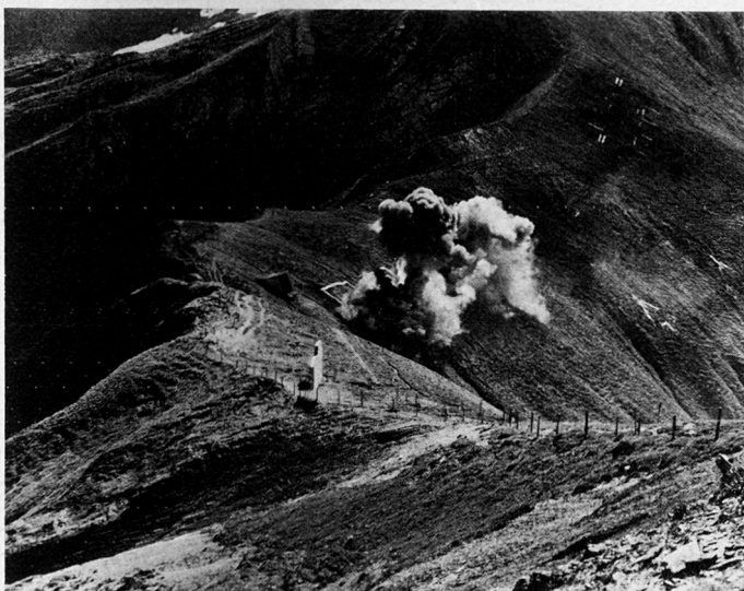
Bild 3. Angriff mit Raketen auf eine Fahrzeugkolonne.