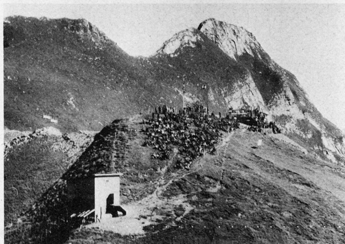
Bild 1. Aufnahme aus dem Tiefstflug mit den automatischen Kameras des «Mirage-III-RS»-Aufklärers. Der Kommandoposten auf Axalp, 2300 m ü. M.

Die geflogenen Übungseinsätze gliederten sich in mehrere Phasen. Eingeleitet wurden die Demonstrationen durch einen Einzelsprung eines Fallschirmgrenadiers, der quasi den Wind im engeren Zielgebiet erflog und bei dem es sich zeigte, daß an