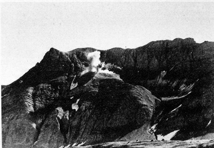
Bild 5. Bombenangriffe auf Ziel A.