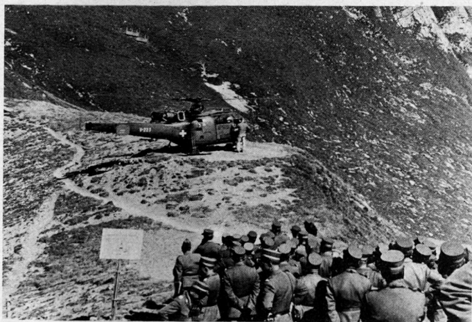
Bild 2. Helikopter-Start- und -Landeplatz auf Axalp.