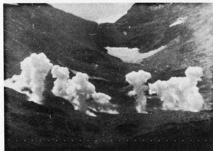
Bilder 8 und 9. Verwendung von Nebel-Geschossen durch die Artillerie

Ferner waren zu allen Übungen die Vertreter von Presse, Radio und Fernsehen geladen worden.