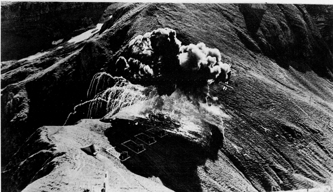
Bild 4. Explosion einer Feuerbombe auf dem Grätli.

dieser Verband eine sehr beachtliche Schießfertigkeit. Den ersten Teil der Demonstration beschloß sodann ein Kanonenangriff mit vier «Mirage IIIS». Diese Flugzeuge zeigten anschließend ihre hohe Beweglichkeit und ihr enormes Beschleunigungsvermögen, Eigenschaften, die insbesondere auch für den Luftkampf von entscheidender Bedeutung sind.