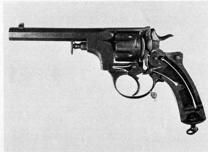
Bild 3. Revolver System R. Schmidt, erstes Modell 1874. Prototyp. Der Lauf kann samt Trommel nach links seitlich ausgeschwenkt und die leeren Hülsen durch den zentralen «Stöbel» entfernt werden.

Die Ansichten einer nachträglich ins Leben gerufenen Revolverkommission, als deren Mitglied wir auch Oberst Wurstemberger sehen, trug zur Lösung der Revolverfrage, durch das Modell 1872 nur provisorisch gelöst, sehr wenig bei.