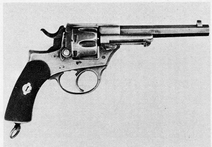
Bild 4. Eidgenössischer Ordonnanz-Revolver 1872 (modifiziert) CDS. Für die Schweizer Armee sind 904 Stück hergestellt worden. Das gleiche Modell, jedoch für Zentralzündung eingerichtet, fand auch in der italienischen Armee Eingang.

berger sehen, trug zur Lösung der Revolverfrage, durch das Modell 1872 nur provisorisch gelöst, sehr wenig bei.