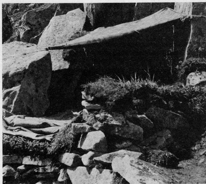
Bild 1. Im Gebirge ist Überleben erstes Gebot.

Weder der Krieg noch der Berg billigen den im Gebirge eingesetzten Truppen mildernde Umstände zu. Um zu bestehen, müssen deshalb auch die Landwehrtruppen, ganz besonders die Landwehrinfanterie, gebirgstüchtig und aggressiv sein sowie wendig geführt werden.