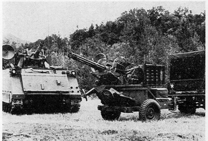
Bild 2. XM 163 mit 20-mm-Flabkanone M61 «Vulcan» (USA). Amerikanische Notlösung mit der bekannten «Gatling»-Revolvierkanone mit sechs Rohren, kleinem Zielverfolgungsradar. Die Rohre werden durch einen Elektromotor zum schnellen Rotieren gebracht, so daß das nächste Rohr schon abgefeuert werden kann, bevor der Ausziehvorgang am vorhergehenden Verschuß beendet ist.