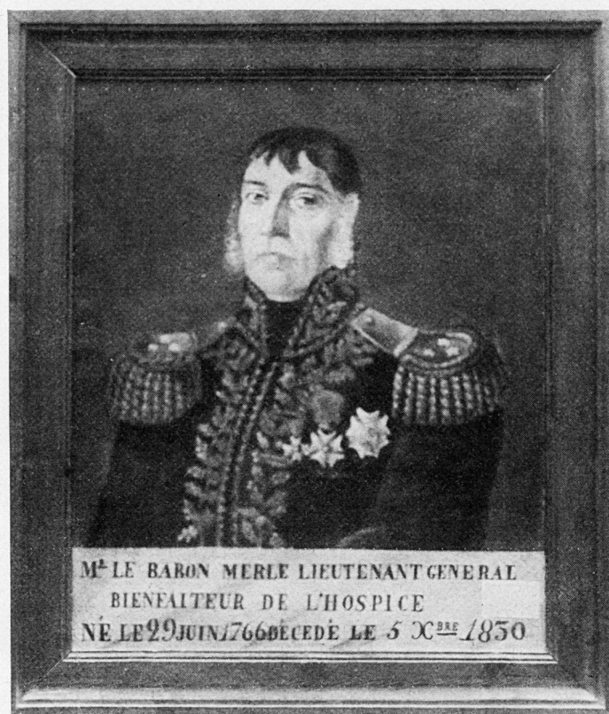
Bild 2. Generalleutnant Merle, französischer Kommandant der «Division suisse».

Den «Roten Schweizern» ist zu Unrecht und wider besseres Wissen von zeitgenössischen französischen Geschichtsschreibern die verdiente Anerkennung nur allzu oft vorenthalten worden. Indessen mag hier hervorgehoben werden, daß im Jahre 1857