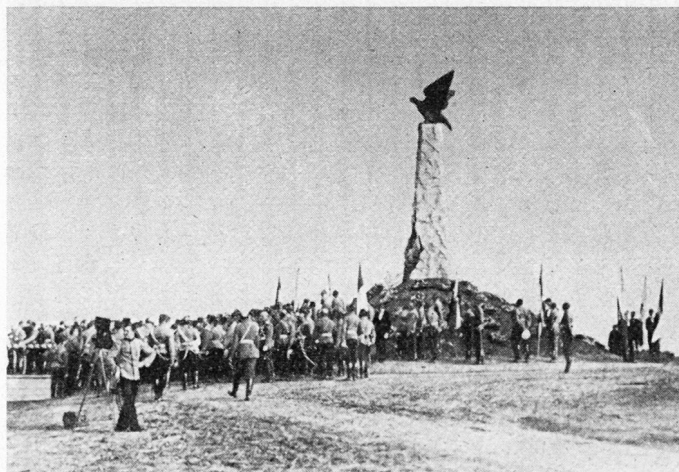
Bild 3. Einweihung des Denkmals für die Große Armee bei Borodino am 7. September 1912. (Aus «L'Illustration» vom 21. September 1912, S. 193.)

An Nachmittag der erwähnten Gedenkfeier erfolgte auf der Schanze von Schewardino bei Borodino im Beisein des Zaren und seiner glänzenden Suite die Einweihung des aus Holz verfertigten, provisorischen französischen Denkmals. Mit diesem sollten, so äußerte sich ein französischer Redner, nicht nur die