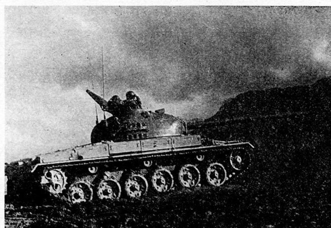
Bild 4. 10,5-cm-Schießen auf dem Gurnigel.

rigkeiten ausgebildeten Panzerbesatzungen bei Erreichen des Landwehralters aus den Panzerformationen herausgenommen werden müssen, um anderswo ihrer Ausbildung widersprechend eingesetzt zu werden. Dies ist noch schwerer zu begreifen, wenn man weiß, wie groß der Kader- und Mannschaftsmangel in den Panzerheiten infolge der Erweiterung der Panzertruppen während der letzten 10 Jahre stets war. Zweifellos bestünde die Möglichkeit, das Landwehralter erreichende Wehrmänner in den Einheiten zu belassen und beispielsweise in Instandstellungs-