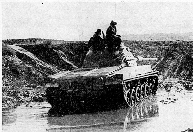
Bild 2. Gefechtstechnische Übung im Fahrschulgelände von Thun.

Die gefechtstechnischen Übungen des vergangenen Wiederholungskurses ließen einen weiteren enormen Vorteil einer «Rekruteneinheit» erkennen. Bei der großen Beanspruchung des Panzerkommandanten im Gefecht (er muß die Verbindung mit seinem vorgesetzten Führer aufrechterhalten und die für sein Fahrzeug in der Verbandsformation zweckmäßige Geländewahl