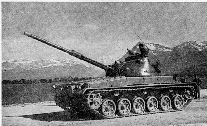
Bild 1. Der Pz. 61.

der Rekrutenschule während der Wiederholungskurse in kürzester Zeit ausgefüllt werden können, beweist das Gesagte und braucht wohl nicht näher begründet zu werden.