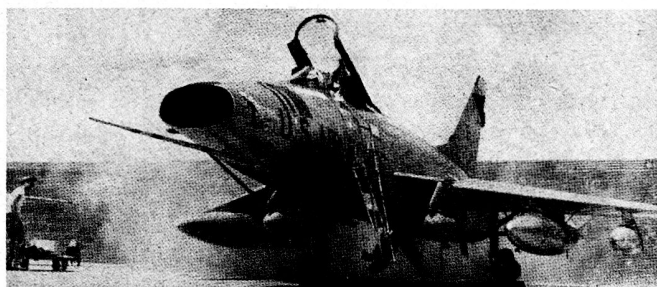
Bild 1. Große Geschwindigkeit und Feuerkraft sind wichtig, in einer minimalen Zeit ein maximales Vernichtungspotential an den Einsatzort zu bringen. Ein F 100-Pilot bereitet sich zum Start vor.

2. Etwa 300 bis 700 Kampfflugzeuge (meistens vom Typ F100 «Supersabre», F105 «Thunderchief» und F5 «Freedom Fighter») stehen heute für die Luftunterstützung zur Verfügung.