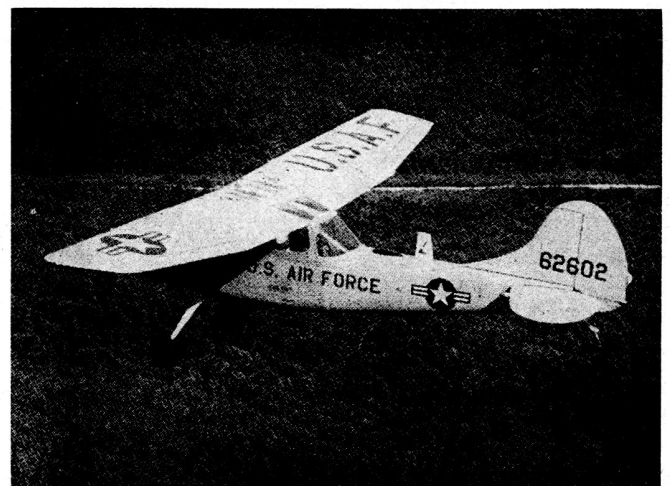
Bild 2. Forward Air Controller, Fliegerleitposten auf einer Cessna.

6. Der Abwurf von Beleuchtungskörpern aus Transportflug-