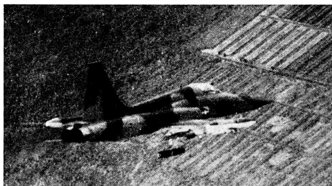
Bild 3. Eine F 5 im Vietnameinsatz.

Der Einsatz bewaffneter Helikopter eignet sich in speziellen Lagen; er ergänzt den Einsatz der taktischen Luftstreitkräfte, ersetzt ihn aber nicht.