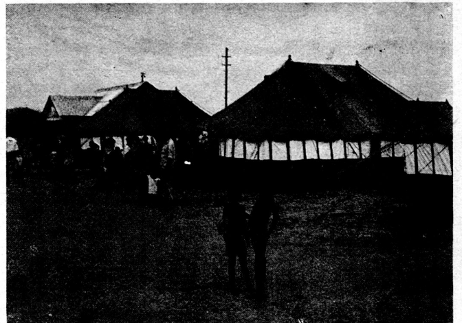
Bild 2. Kongo: Eingeborene warten vor einer Feldambulanz auf medizinische Betreuung durch Soldaten des österreichischen UN-Sanitätskontingentes.