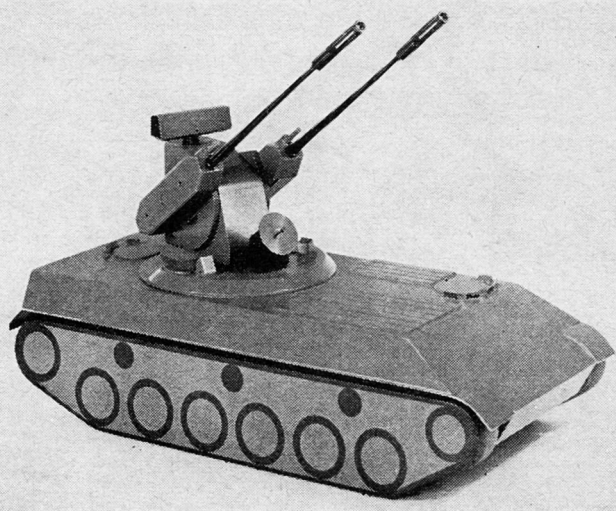
Bild 2. Modell eines Flabpanzers mit Such- und Vermessungsradar und 35-mm-Flabzwilling.

Bild 2 zeigt als Beispiel für eine moderne Lösung das Modell eines Flabpanzers, an dem zur Zeit durch eine schweizerische Firmengemeinschaft entwickelt wird. Der Panzer ist mit leistungsfähigem Radarsystem und 35-mm-Zwillingsgeschütz ausgerüstet.