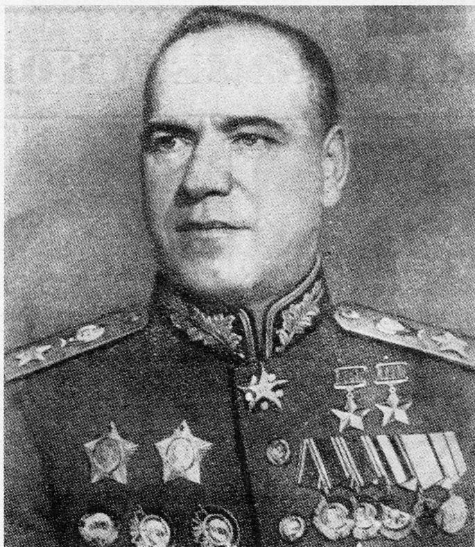
Bild 6. Marschall G. K. Schukow, Oberbefehlshaber der ersten weißrussischen Front.