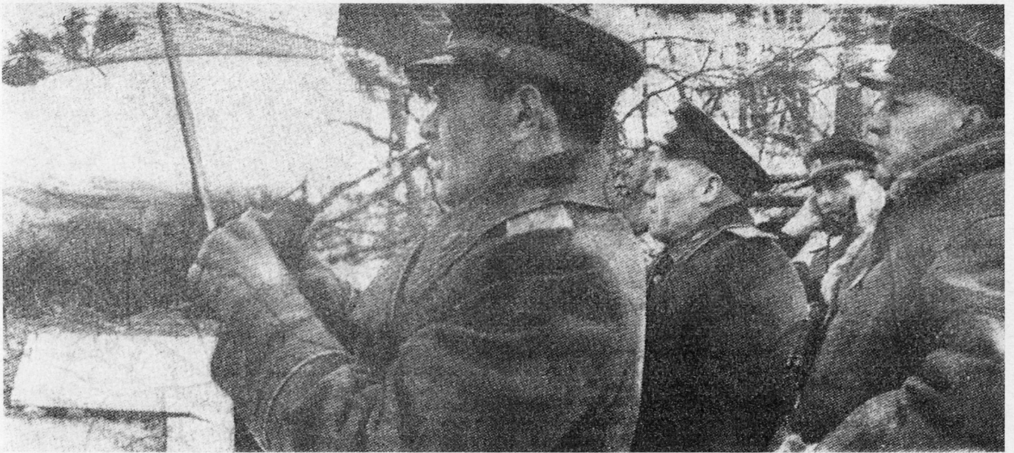
Bild 9. General Tschuikow (links) auf dem Beobachtungspunkt Höhe 81,5 an der Oder.