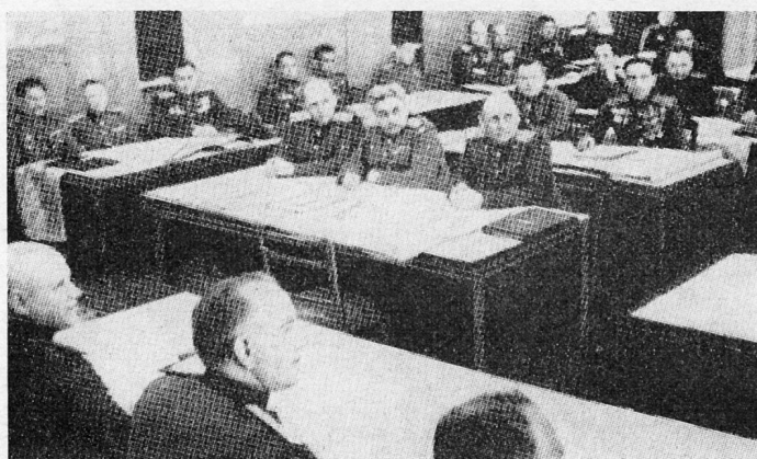
Bild 10. Der Stab der ersten ukrainischen Front bereitet die Großoffensive gegen Berlin vor.

«Die Nacht vom 15. zum 16. April kam mir ungewöhnlich lang vor... Schon vor dem Morgengrauen erschien Marschall Schukow auf meinem Gefechtsstand. Zu diesem Zeitpunkt hatten die Truppen der Armee bereits ihre Ausgangsstellungen bezogen. Die Truppenkommandanten waren mit den Gardefahnen an die Hauptkampflinie gekommen. Die Kämpfer schworen angesichts der Fahne, die ihnen gestellten Kampfaufgaben in Ehren zu erfüllen. Leuchtkugeln schossen zum dunklen Himmel empor, und das Bildnis Lenin blickte, als lebte er, von dem roten Tuch auf die Befreiungskämpfer, als rufe er sie zur Entschlossenheit in der letzten Schlacht gegen den verhaßten Feind auf. Drei Uhr morgens... Der Sekundenzeiger drehte den letzten Kreis. Die noch über der Erde liegende Dunkelheit schien auf einmal zu