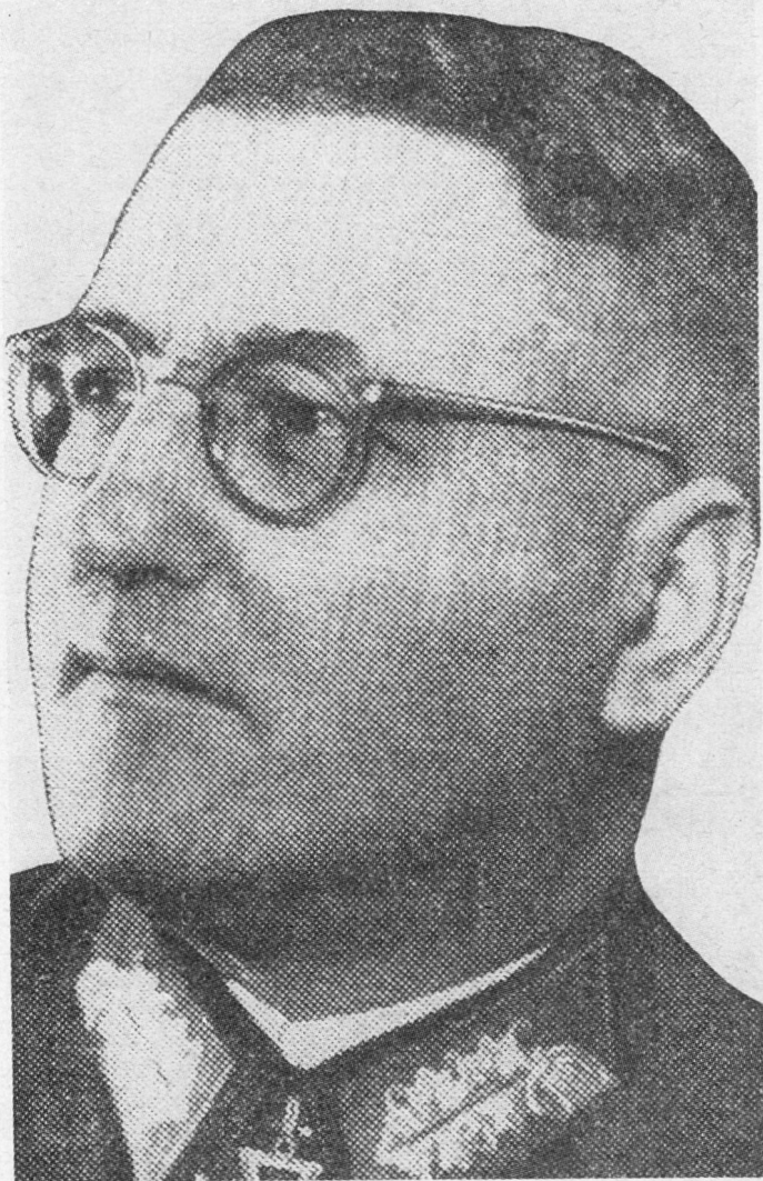
Bild 4. General der Infanterie Theodor Buße, Oberbefehlshaber der 9. Armee.