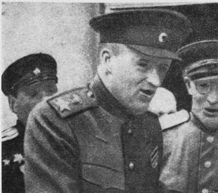
Bild 7. Marschall K. K. Rokossowkij, Oberbefehlshaber der zweiten weißrussischen Front.

Die letzten Tage vor der großen Offensive gingen im Banne des bevorstehenden Angriffs vorüber. Die gewaltige sowjetische Streitkraft stand sprungbereit vor der Oder-Neiße-Linie. Ihre Reihen waren aufgefüllt. Die Verstärkung für die diversen Armeen war rechtzeitig eingetroffen. Neue Kampfmethoden wurden seit Wochen erprobt und für den bevorstehenden Angriff