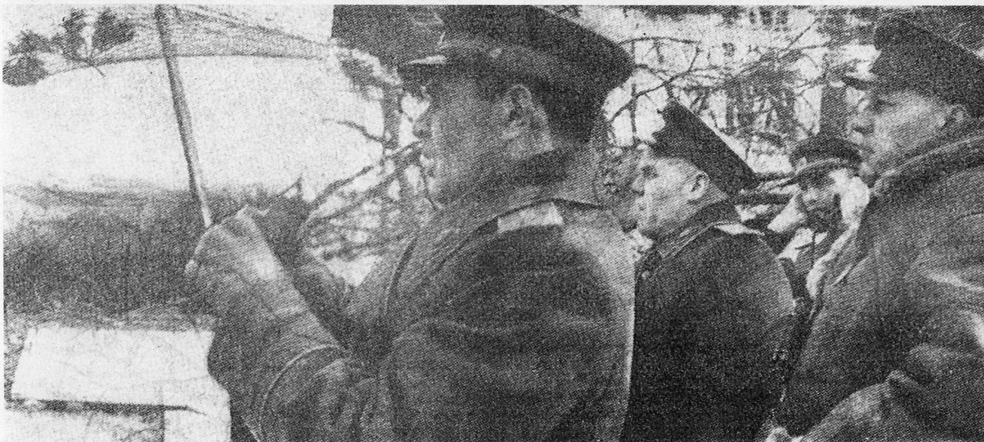
Bild 9. General Tschukow (links) auf dem Beobachtungspunkt Höhe 81,5 an der Oder.