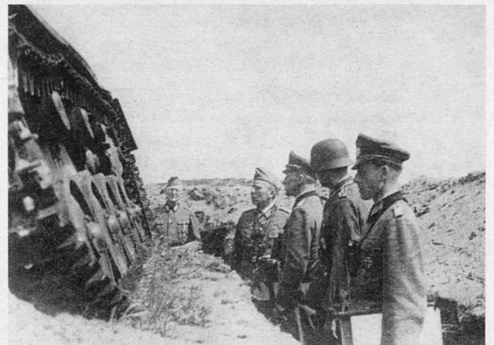
Bild 2. Generaloberst G. Heinrici (zweiter von links). Oberbefehlshaber der Heeresgruppe Weichsel.