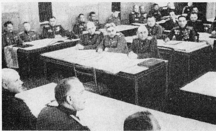
Bild 10. Der Stab der ersten ukrainischen Front bereitet die Großoffensive gegen Berlin vor.

«Die Nacht vom 15. zum 16. April kam mir ungewöhnlich lang vor. . . Schon vor dem Morgengrauen erschien Marschall Schukow auf meinem Gefechtsstand. Zu diesem Zeitpunkt hatten die Truppen der Armee bereits ihre Ausgangsstellungen bezogen. Die Truppenkommandanten waren mit den Gardefahnen an die Hauptkampflinie gekommen. Die Kämpfer schworen angesichts der Fahne, die ihnen gestellten Kampfaufgaben in Ehren zu erfüllen. Leuchtkugeln schossen zum dunklen Himmel empor, und das Bildnis Lenin blickte, als lebte er, von dem roten Tuch auf die Befreiungskämpfer, als rufe er sie zur Entschlossenheit in der letzten Schlacht gegen den verhaßten Feind auf. Drei Uhr morgens . . . Der Sekundenzeiger drehte den letzten Kreis. Die noch über der Erde liegende Dunkelheit schien auf einmal zu