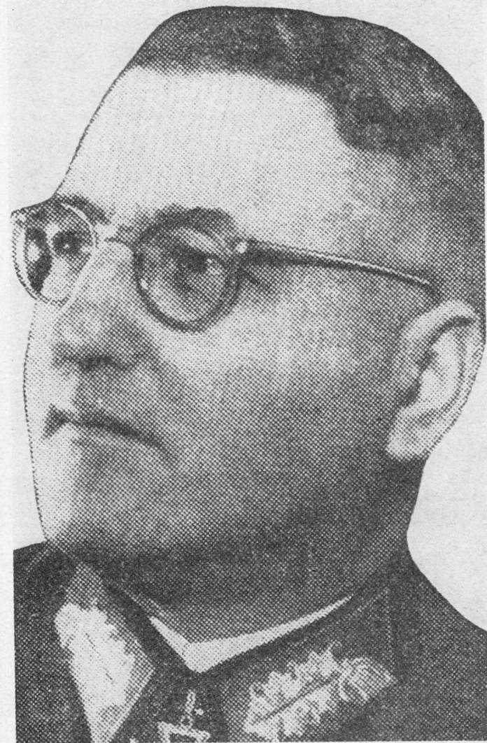
Bild 4. General der Infanterie Theodor Buße, Oberbefehlshaber der 9. Armee.