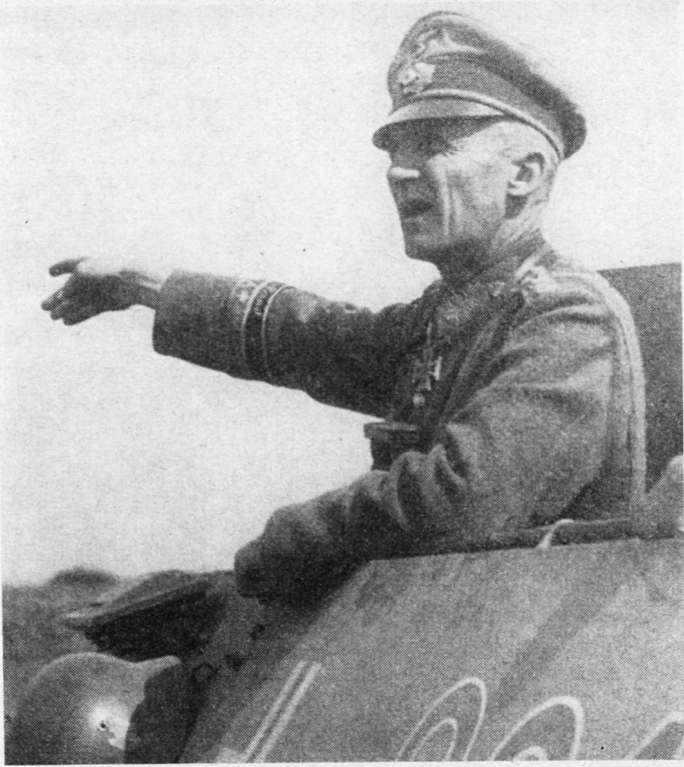
Bild 3. General H. von Manteuffel, Oberbefehlshaber der 3. Panzerarmee.