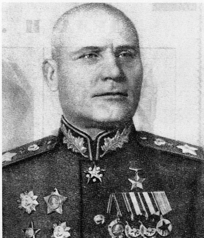
Bild 5. Marschall I. S. Konjew, Oberbefehlshaber der ersten ukrainischen Front.