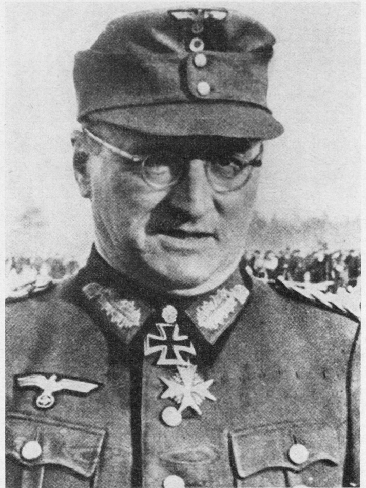
Bild 1. Generalfeldmarschall F. Schörner, Oberbefehlshaber der Heeresgruppe Mitte.