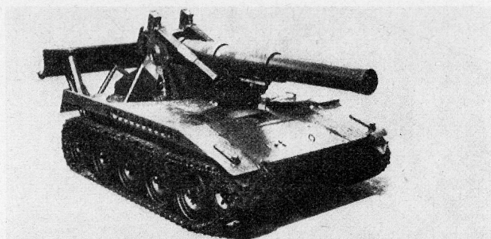
Selbstfahrhaubitze M 110 (USA)

Abmessungen wie Panzerhaubitze AMX; Motor: Benzin; Kaliber: 155 mm; Schußweite: etwa 15 km; Schwenkbereich: beschränkt; Gewicht: etwa 17 t.