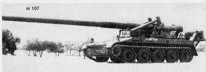
Selbstfahrkanone M 107 (USA)

Abmessungen: Länge (einschließlich Rohr) 11,3 m, Breite 3,15 m, Höhe 3,47 m; Motor: Diesel; Kaliber: 175 mm; Schußweite: etwa 32 km; Schwenkbereich: \pm 535 ‰; Gewicht: etwa 28 t.