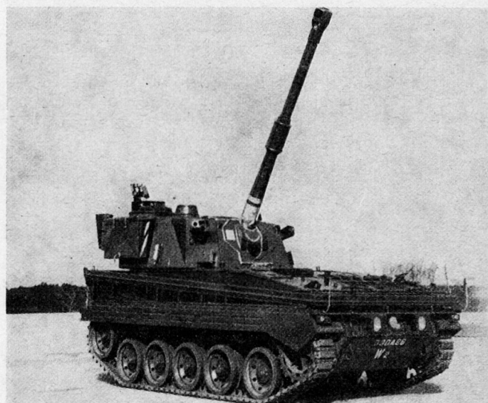
Panzerhaubitze «Abbot» (GB)

Abmessungen: Länge 5,7 m, Breite 2,51 m, Höhe 2,77 m; Motor: Benzin; Kaliber: 105 mm; Schußweite: etwa 14 km; Schwenkbereich: 360° (6400 \frac{0}{100} ); Gewicht: 17 t.