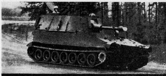
Panzerhaubitze M 108 (USA)

Abmessungen: Länge 5,83 m, Breite 2,64 m, Höhe 2,65 m; Motor: Vielstoff; Kaliber: 105 mm; Schußweite: etwa 17 km; Schwenkbereich: 360° (6400 \frac{0}{100} ); Gewicht: etwa 16 t; schwimmfähig.