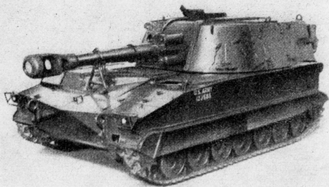
Panzerhaubitze M 109 (USA)

Abmessungen: Länge 5,7 m, Breite 3,15 m, Höhe: 2,59 m; Motor: Diesel; Kaliber: 155 mm; Schußweite: etwa 18 km; Schwenkbereich: 360° (6400 ‰); Gewicht: etwa 22 t; schwimmfähig.