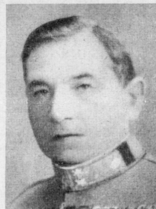
Bild 3. Generalleutnant i. R. János Kiss.

Wissenschaftler und Schriftsteller schrieben, war eine Station auf dem Weg zum Ziel der Bewegung. «Wie unsicher auch der Ausgang des Kampfes ist, er kann keine endgültige Niederlage für eine großherzige und tapfere Nation bringen, wenn sie sich mit ganzer Kraft auch den vielfach stärkeren Mächten entgegenstellt. . .» Mit diesen Worten wandte sich Bajcsy-Zsilinszky an das ungarische Volk in den Spalten der «Népszava», und die «vielfach stärkeren Mächte», gegen die er die Ungarn zum Kampf aufrief, waren in diesem Fall Hitler-Deutschland und die von diesem hervorgerufene «neue Ordnung» in Europa.