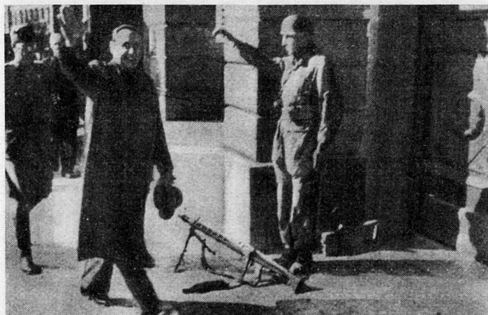
Bild 1. Major i. Gst. a. D. Ferenc Szálasi, der Führer der ungarischen Nationalsozialisten, zieht am 16. Oktober 1944 in die von deutschen Fallschirmjägern besetzte königliche Burg in Budapest ein.

Es ist im Westen wenig bekannt, daß im Spätherbst 1944 in Budapest einige hohe ungarische Offiziere in Verbindung mit Politikern bürgerlicher Prägung trotz dem mißglückten «Aufstand der Generale» in Hitler-Deutschland sich gegen das in Ungarn herrschende Regime wandten. Die verzweifelte Lage des Landes zwang sie zu dieser Tat. Am 15. Oktober 1944 mißlang nämlich der Versuch des Reichsverwesers Miklós von Horthy, Ungarn durch einen Separatfrieden aus dem Kriege zu retten und somit dem Volk das Leiden eines totalen Krieges auf eigenem Boden zu ersparen 1 . Der deutsche Sicherheitsdienst, der aus den Geschehnissen in Bukarest und Sofia anscheinend die Lehre gezogen hatte, schlug rechtzeitig zu, erstickte von Horthys Versuch im Keim, nahm den greisen Reichsverweser in Gewahrsam und setzte an seine Stelle den Führer der ungarischen Nationalsozialisten, den «Pfeilkreuzler» Major i. Gst. a. D. Ferenc Szálasi, ein 2 . «Der Führer der Nation» (Nemzetvezető), wie Szálasi sich nachher bescheiden nannte, erwies sich von der ersten Minute seiner Machtübernahme an als ergebener Diener Hitlers. Der Kampf, welcher für Ungarn ohne nationales Inter-