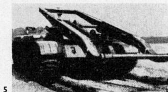
Der russische Brückenlegepanzer T-54/Br

Der T-54/Br ist ein Fahrzeug mit horizontal verschiebbarer Tafelbrücke aus zwei Spurbahnen, das etwa 12 m überbrücken kann.