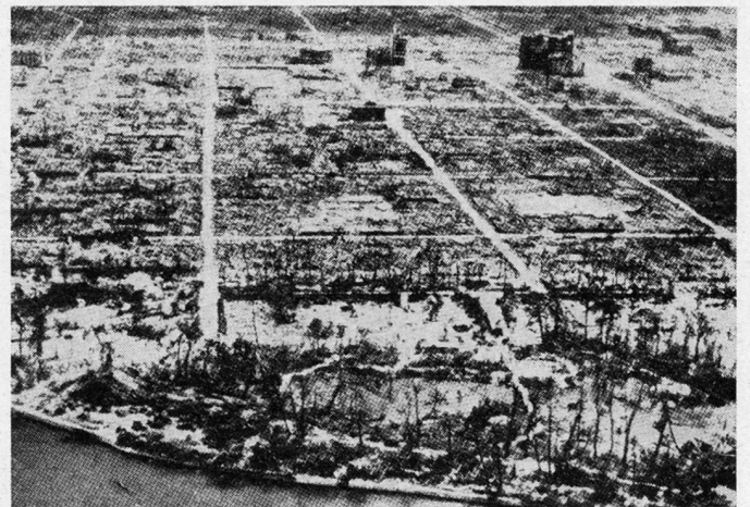
Bild 3. Nach der Explosion: Blick auf den fast völlig zerstörten Stadtkern von Hiroshima

Auch diese Feststellung möchte man als Selbstverständlichkeit bezeichnen. Solange wir aber nicht über diejenigen Mittel verfügen, welche mit hoher Wahrscheinlichkeit sicherstellen, daß unsere Armee auch wirklich zum Einsatz kommt, wir diese Karte überhaupt ins jeu legen können, bedeuten solche Gedanken-