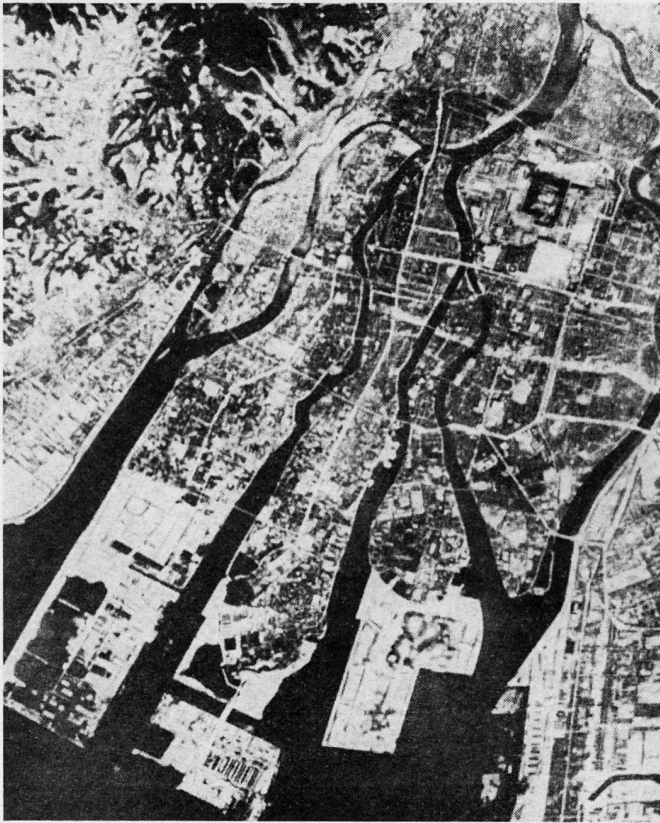
Bild 1. Luftbild von Hiroshima vor...