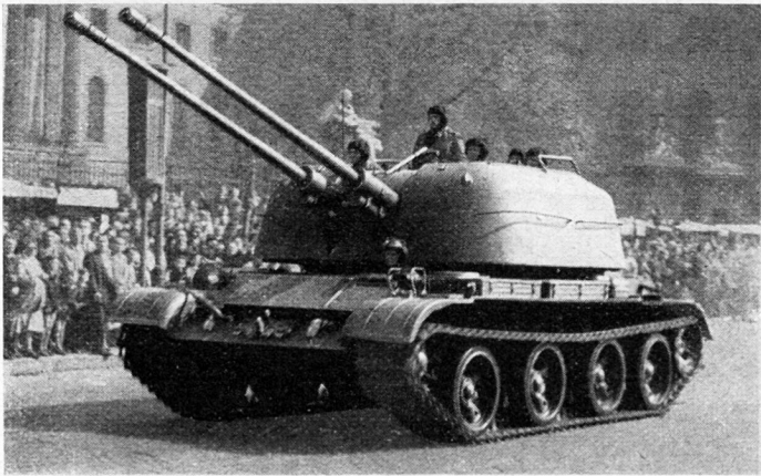
Bild 1. Russischer Flabpanzer SU 57-2