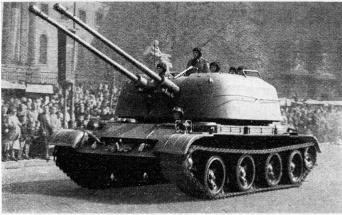
Bild 1. Russischer Flakpanzer SU 57-2