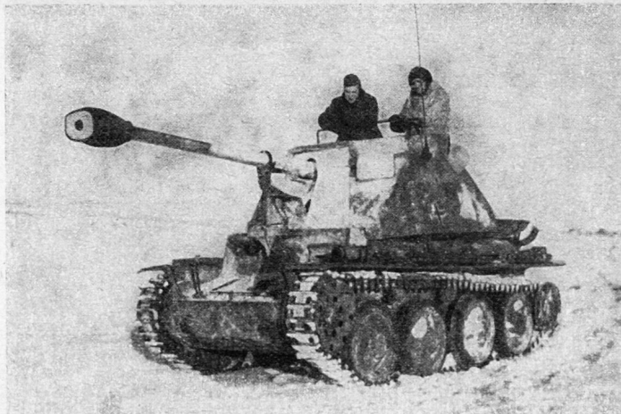
7,62-cm-Pak auf Skoda 38-t-Fahrgestell

Im Frühjahr 1944 traf dort die neue Ausrüstung ein: 27 Stück Jagdpanzer IV/lang, ausgerüstet mit einer 7,5-cm-Kanone lang auf Panzer-IV-Fahrgestell. Dieses etwas buglastige Fahrzeug war von gleicher Beweg-