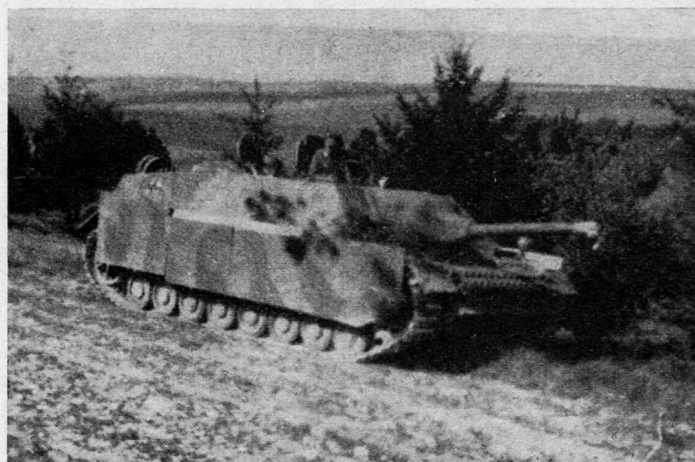
7,5-cm-Kanone lang auf Panzer-IV-Fahrgestell