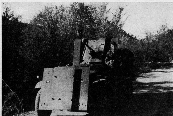
3,7 cm Pak selbstfahrend

1943/44 war die Ausbildung dagegen wesentlich besser auf die Frontanfordernisse abgestellt. Die Grundausbildung wurde auf das Allernötigste beschränkt; die Gefechtsausbildung stand im Vordergrund. Der Dienst betrug 75 Wochenstunden, davon mußte sich mindestens ein Drittel bei Nacht abspielen. Jede Rekr.Kp. mußte mindestens eine