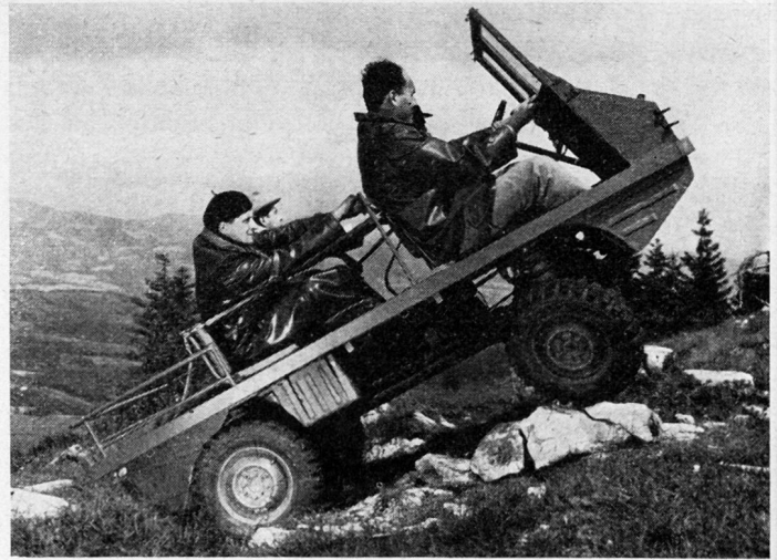
Geländelastwagen Haflinger bei Steigversuchen im Gelände. Für den Einsatz in der Armee dürfen keine Personen auf der Ladebrücke transportiert werden

Der Fahrer bedient das vollsynchronisierte Fünfganggetriebe mit einem normalen Schalthebel. Die Einscheibenkupplung wird durch Pedal betätigt, ebenso die hydraulische Vierradtrommelbremse. Der Vorderradantrieb kann während der Fahrt ein- und ausgeschaltet werden. Sowohl die Vorderräder wie auch die Hinterräder sind je mit einem Sperrdifferential versehen, die während der Fahrt einzeln eingeschaltet werden können. Der erste Getriebegang ist als Kriechgang ausgebildet und gestattet eine Mindestgeschwindigkeit von 2,5 km/h, so daß das Fahrzeug auch an Steigungen im Fußmarsch begleitet werden kann. Andererseits erlaubt die Höchstgeschwindigkeit von 60 km/h im fünften Gang das Halten des Tempos von flüssig fahrenden Kolonnen von leichten Geländelastwagen. Die weiche Federung besteht aus Schraubenfedern und zusätzlichen, progressiv wirkenden Gummihohlfedern.