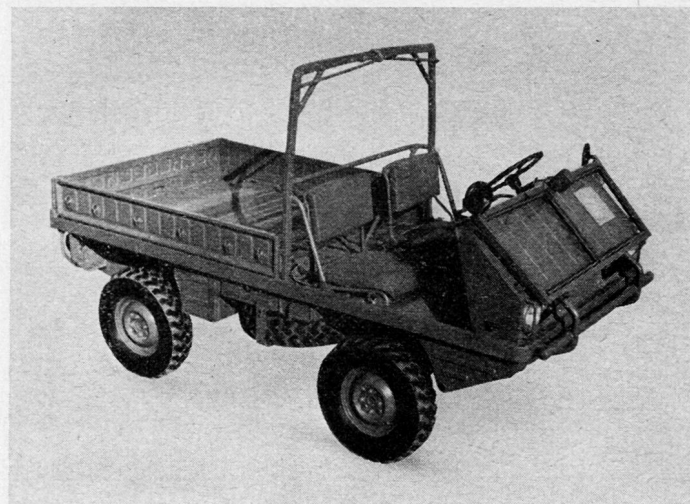
Das Fahrzeug mit demontiertem Verdeck und nach vorn abgeklappter Windschutzscheibe