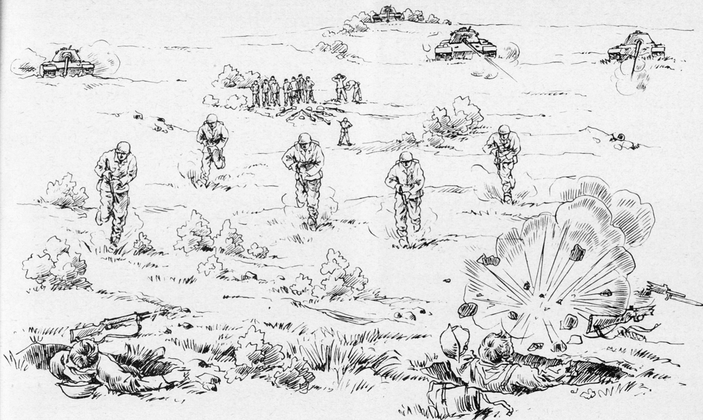
Skizze 1 Stoßkraft hat die Infanterie so viel, wie sie Unterstützung hat

ben der Sache zu dienen, wenn sie bei jeder Gelegenheit klarzumachen versuchen, daß die Infanterie wie eh und je «alles» kann. Ihre Planspiele und ihre Veröffentlichungen in der Fachpresse mindern den Kredit des Infanteristen als glaubwürdigen Gesprächspartners.