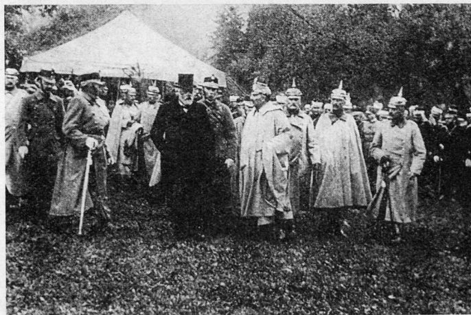
Bundesrat Forrer begleitet den Kaiser, der von seinem Gefolge umgeben ist. Dazwischen Oberstkörpskdt. Sprecher von Bernegg

Zwar brachte das Ende des 19. Jahrhunderts noch sehr ernsthafte diplomatische Konflikte der Schweiz mit Preußen. Insbesondere der «Wohlgemuth-Handel» vom Jahre 1889, in welchem Bismarck kein Glanzstück seiner Politik leistete, brachte erhebliche Spannungen, die bei der Verärgerung des Kanzlers leicht hätten zu ernsthaften Verwicklungen führen können. Kaiser Wilhelm II. hat sich damals schlichtend für die Schweiz ins Mittel gelegt. Ähnliche Differenzen mit Bismarck gab es später noch mehr. Wäre es dabei zu einem ernsthaften Konflikt gekommen, wäre es ein durchaus «direkter», unmittelbar gegen die Schweiz gerichteter Krieg gewesen, nicht ein «indirekter»,