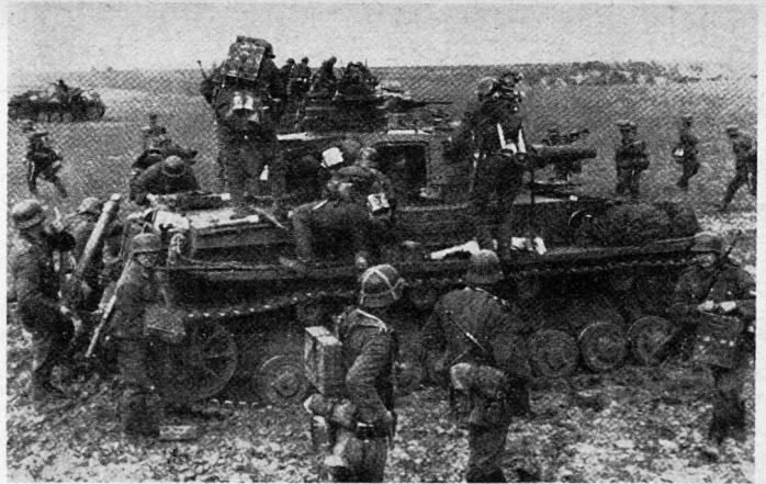
Bereitstellung einer gepanzerten Kampfgruppe: die Begleitinfanterie sitzt zum Angriff auf

Bei starker feindlicher Luftüberlegenheit oder bei Luftherrschaft des Gegners konnten größere Bewegungen nur nachts ausgeführt werden. Die Pz.KG wurde für den Tag in kleine und kleinste Pakete zerlegt, die in günstigen, weit auseinandergezogenen und in die Tiefe gegliederten Stellungen sich gegenseitig bei der Abwehr des Gegners unterstützten. Die erlaubten und überhaupt möglichen Bewegungen waren das Beziehen von Wechsel-