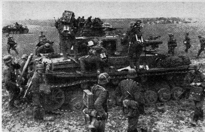
Bereitstellung einer gepanzerten Kampfgruppe: die Begleitinfanterie sitzt zum Angriff auf

Bei starker feindlicher Luftüberlegenheit oder bei Luftherrschaft des Gegners konnten größere Bewegungen nur nachts ausgeführt werden. Die Pz.KG wurde für den Tag in kleine und kleinste Pakete zerlegt, die in günstigen, weit auseinandergezogenen und in die Tiefe gegliederten Stellungen sich gegenseitig bei der Abwehr des Gegners unterstützten. Die erlaubten und überhaupt möglichen Bewegungen waren das Beziehen von Wechsel-