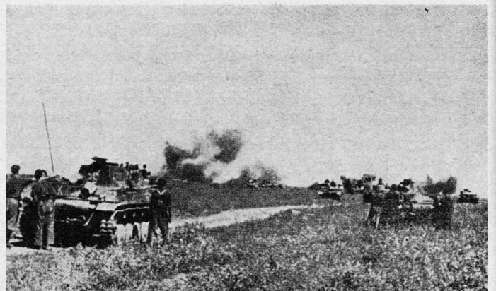
Vor zwanzig Jahren: Deutsche Panzerspitzen vor Rostow. Juli 1942 (Aus dem Buch: «Der zweite Weltkrieg», erschienen im Verlag Welsermühl, Wels OÖ.)

c. Versorgung: Die Zerlegung der in der Pz.KG zusammengefaßten Abteilungen in Kompagnien und Züge, manchmal Gruppen, und die Bildung von Unterkampfgruppen mit diesen Teilen stellte die bis dahin übliche Kompagnie-, Abteilungs- beziehungsweise Bataillons- und Regimentsversorgung vor unlösbare Probleme. Erst das Abrücken von der Kompagnieversorgung brachte die Lösung. Vorerst versorgten sich die Abteilun-