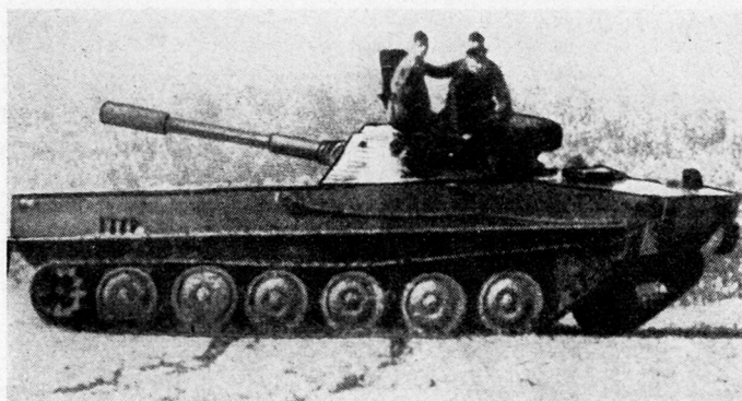
Bild 1. Spähpanzer PT 76

Seit etwa 1956 ist der schwimmbfähige Spähpanzer PT 76 bei den russischen Aufklärungstruppen eingeführt. Gewicht zirka 16 Tonnen. Dieselmotor 300–350 PS. Straßengeschwindigkeit zirka 50 km/h. Wassergeschwindigkeit 8–10 km/h. Bewaffnung: Eine 76,2-mm-Kanone L48 (es besteht eine Version mit einer kürzeren 85-mm-Kanone), ein koaxiales Maschinengewehr.