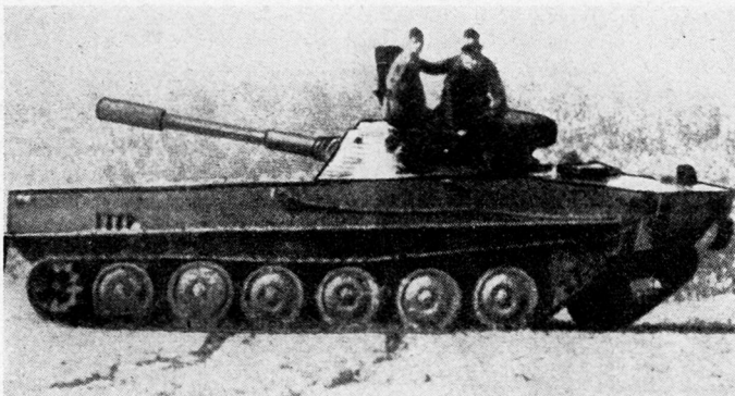
Bild 1. Spähpanzer PT 76

Seit etwa 1956 ist der schwimmfähige Spähpanzer PT 76 bei den russischen Aufklärungstruppen eingeführt. Gewicht zirka 16 Tonnen. Dieselmotor 300–350 PS. Straßengeschwindigkeit zirka 50 km/h. Wassergeschwindigkeit 8–10 km/h. Bewaffnung: Eine 76,2-mm-Kanone L48 (es besteht eine Version mit einer kürzeren 85-mm-Kanone), ein koaxiales Maschinengewehr.