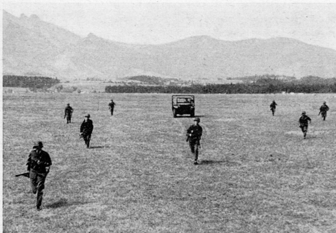
Bild 3. Motordragoner-Gefechtsgruppe abgesessen; Fahrzeug folgt unmittelbar mit der Gruppe (z.B. in coupiertem Gelände)

Den heutigen Motordragoner-Bataillonen waren grundsätzlich folgende Aufgaben zugeordnet, welche sinngemäß auch auf die Aufgaben der Leichten Brigaden übertragen werden können: