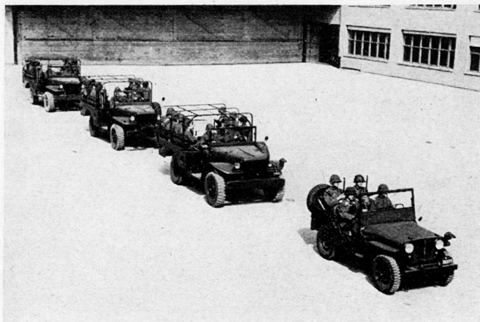
Bild 1. Motordragoner-Gefechtszug aufgesessen

An Kader und Truppe werden durch diese Motorisierung erhöhte Anforderungen gestellt. Zu der Gefechtstechnik an und für sich kommen die unzähligen Probleme des motorisierten Denkens und Führens hinzu, welche in allen Fällen rasches Handeln und bewegliche Anpassung an die Verhältnisse fordern. Ich denke hier beispielsweise an das erschwerte Kartenlesen bis auf die Stufe der Gruppenführer, die Inmarschsetzung einer Schwadron mit rund 25 Fahrzeugen, die Führung während des Marsches selber bei einer Kolonnenlänge von drei bis vier Kilometern, das flüssige Indeckunggehen, das stete Freihalten der Straße bei taktischen und technischen Halten.