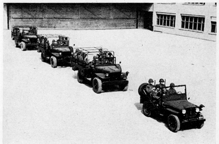
Bild 1. Motordragoner-Gefechtszug aufgefassen

An Kader und Truppe werden durch diese Motorisierung erhöhte Anforderungen gestellt. Zu der Gefechtstechnik an und für sich kommen die unzähligen Probleme des motorisierten Denkens und Führens hinzu, welche in allen Fällen rasches Handeln und bewegliche Anpassung an die Verhältnisse fordern. Ich denke hier beispielsweise an das erschwerte Kartenlesen bis auf die Stufe der Gruppenführer, die Inmarschsetzung einer Schwadron mit rund 25 Fahrzeugen, die Führung während des Marsches selber bei einer Kolonnenlänge von drei bis vier Kilometern, das flüssige Indeckunggehen, das stete Freihalten der Straße bei taktischen und technischen Halten.